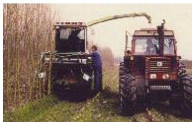
Récolte du TCR grâce à une ensileuse, les plaquettes sont envoyés dans la remorque

Il est possible de revenir à une culture ordinaire après celle du taillis sans dépense exagérée par un broyage des souches au rotavator.