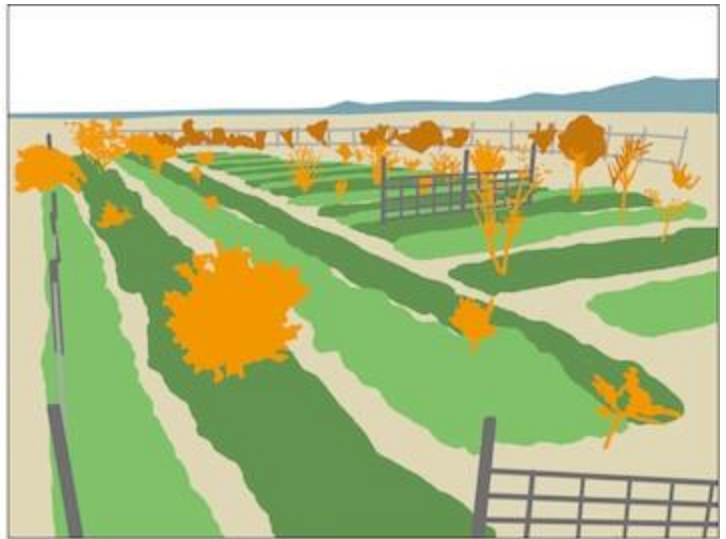
Surface productive Arbre fruitier Palissage pour les plantes grimpantes