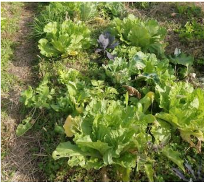
Images 3 et 4. Champ expérimental de la synécoculture sur la surface de 1000 m 2 à Issé, Japon. Il se compose des surfaces productives surélevées de 30 cm, des passages pour la récolte et le maintien, des arbres fruitiers de 1-3 m, et les palissages autour du champ pour les plantes grimpantes (Photo prise en fin novembre 2010) (© Masatoshi Funabashi, Sony Computer Science Laboratories, Inc., Tokyo, Japan).