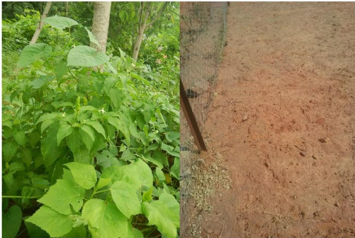
Image 1. A) Zone de démonstration de la synéculture, après 18 mois d'installation, à Fada N'Gourma, à gauche (7 Sep 2016, angle B). b) Zone témoin comme contrôle, à droite (17 Nov 2016, angle D).

Le seuil absolu de pauvreté monétaire pour la vie à Ouagadougou est estimé à 153 530 FCFA en 2014 (INSD, 2015). Le rendement annuel de la synéculture correspond 50 fois plus que ce seuil. Cela signifie en moyenne 10 m 2 de champ en synéculture est suffisant pour soutenir le niveau de vie minimal d'une personne dans la capitale. 7151 hectares des champs de synéculture (l'intervalle de confiance 95% comprise entre 6740-7579 hectares) serait suffisant pour sortir la population entière du Burkina Faso au-dessus du seuil de pauvreté.