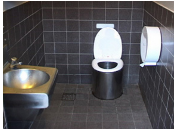
Vue d'un WC à compost, sur l'autoroute E6 en Suède