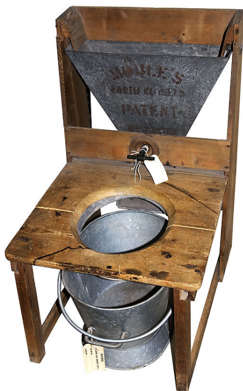
Version améliorée du premier modèle déposé (1875)

mal dans l'eau. Bactéries et substances chimiques que nous rejetons nécessitent un traitement plus long pour être aussi inoffensives que l'eau grise (eau de lavage). Donc la chasse d'eau des WC augmente considérablement la charge des stations d'épuration en volume et en puissance. Dans le cas d'un traitement par bassins plantés (lagunage) des eaux grises, l'usage de toilettes sèches permet de diminuer le nombre de bassins successifs et de simplifier le traitement, le rendant accessible aux maisons individuelles.