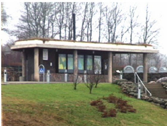
Toilettes publiques à compost, sur l'autoroute E6 en Suède

Dans les pays occidentaux, environ 35 % à 40 % de l'eau potable passe à l'égout, principalement dans les zones urbanisées, la fosse septique étant plus courante dans les zones rurales. L'intérêt des toilettes sèches, outre le fait de ne pas utiliser d'eau du tout, est aussi de recycler/valoriser des matières qui habituellement sont rejetées à l'égout et nécessitent des opérations d'épuration des eaux usées. Des toilettes sèches d'abord utilisées pour les refuges et zones isolées ont été adaptées pour des festivals regroupant plusieurs dizaines de milliers de visiteurs, et y ont rencontré de franc succès. Il suffit de prévoir des panneaux explicatifs, l'entretien nécessaire et un peu de surveillance. Elles deviennent ainsi une alternative raisonnable aux toilettes chimiques.