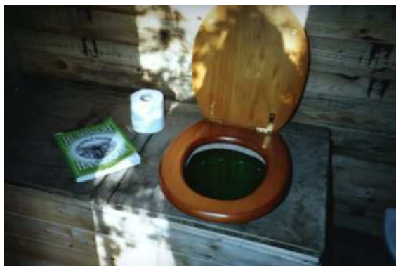
Exemple d'aménagement de toilettes sèches en Angleterre.