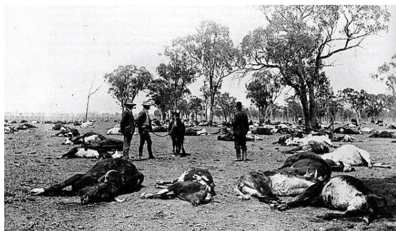
En 1907, sept cents bovins ont été tués durant la nuit en Australie par une mauvaise herbe vénéneuse [1]

Une mauvaise herbe nuisible (en anglais noxious weed ) est une notion propre au monde anglo-saxon. Il s'agit d'espèces de mauvaises herbes qui ont été désignées dans certains pays par des autorités agricoles nationales ou régionales comme étant préjudiciables aux cultures agricoles ou horticoles, aux habitats naturels et écosystèmes, ou encore à l'homme ou au bétail. Ce sont le plus souvent des espèces introduites (non-indigènes) et qui ont été introduites dans un écosystème par ignorance, mauvaise gestion, ou par accident. Parfois, certaines sont indigènes. Généralement, ce sont des plantes qui poussent agressivement, se multiplient rapidement, sans ennemis naturels (herbivores indigènes, chimie du sol, etc), et qui affectent de manière négative les habitats naturels, les terres cultivées, ou qui sont nuisibles pour l'homme, la faune indigène ou le bétail, que ce soit par contact ou par ingestion. Les mauvaises herbes nuisibles sont un grand problème dans de nombreuses régions du monde, ce qui affecte grandement les zones agricoles, d'aménagement forestier, de préservation de la nature et les parcs ainsi que d'autres espaces ouverts [2] .