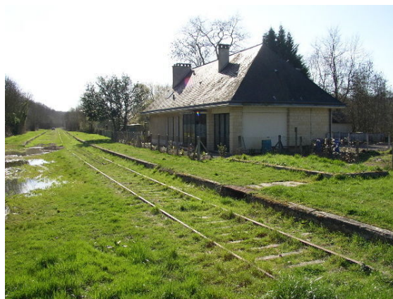
Les anciennes voies ferrées (ou cavaliers miniers) peuvent, avec une gestion adéquate acquérir des fonctions de corridors jusque dans les zones urbaines et industrielles. Elles sont souvent transformées en chemins de promenade