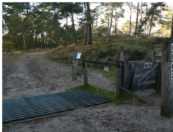
Des systèmes simples de type Pas canadien ; constitué de tubes ronds disposés parallèlement au-dessus du vide, constituant une barrière qui effraye de nombreux animaux, empêchent les entrées ou sorties de certains animaux sauvages dans les réserves naturelles, mais permettant le passage de l'Homme et de véhicules (Réserve naturelle belge de Kalmthout)