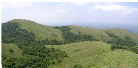
Ici les corridors boisés protègent également les cours d'eau du ruissellement et de l'érosion (Brahmagiris, Coorg, Inde)