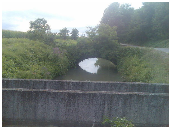
La végétalisation des parois de ce pont augmente son potentiel d'utilisation comme corridor