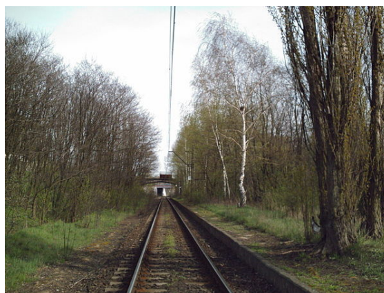
Les voies existantes, avec une gestion appropriée peuvent avoir un rôle de corridor, mais dans les zones d'accélération ou de décélération, des trains nettoyeurs doivent débarrasser les rails des feuilles mortes qui font patiner les trains [4] .