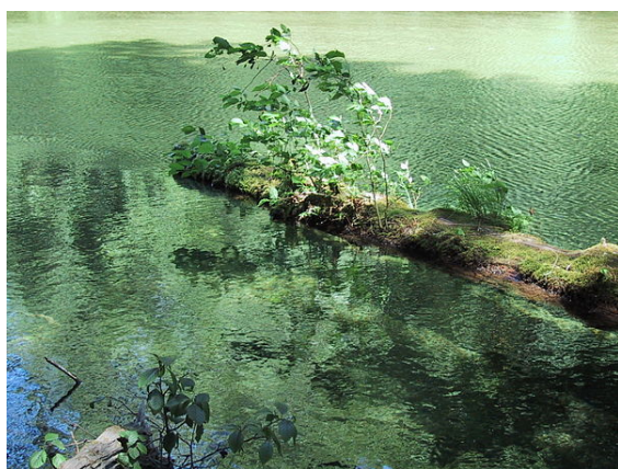
Tronc mort sur une rivière de la Forêt pluvieuse de l'île de Vancouver (Colombie Britannique, Canada). De tels troncs en descendant les fleuves à l'occasion d'une inondation par exemple peuvent naturellement transporter des propagules de dizaines d'espèces de plantes et lichens, et des propagules de centaines d'espèces d'invertébrés et microorganismes sur des distances parfois importantes et jusqu'en mer. Noter les arbres qui sont déjà en train de pousser dans le bois en décomposition, profitant de l'humidité et de la lumière reflétée par l'eau. C'est ainsi aussi qu'on peut parfois trouver des arbres dont on ne comprend pas comment ils auraient pu germer ou s'enraciner sous l'eau.