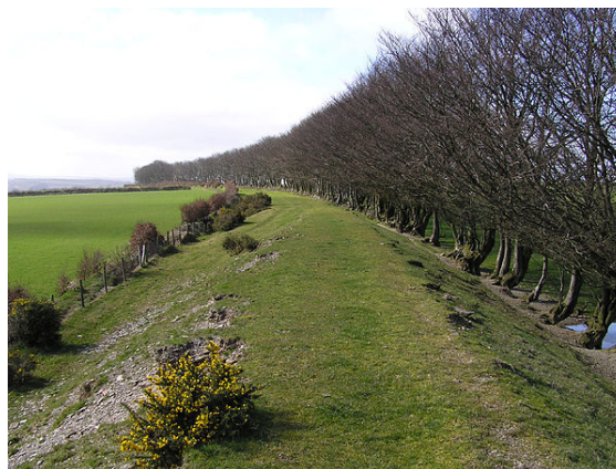
Autre exemple, en talus bordé d'arbres, d'ancienne voie ferrée pouvant développer une vocation de corridor biologique