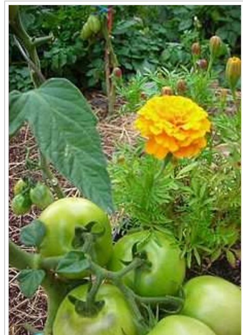
Plantes auxiliaires : œillet d'Inde ou tagète avec tomates.

Ces plantes n'ont pas de contre-indications particulières :