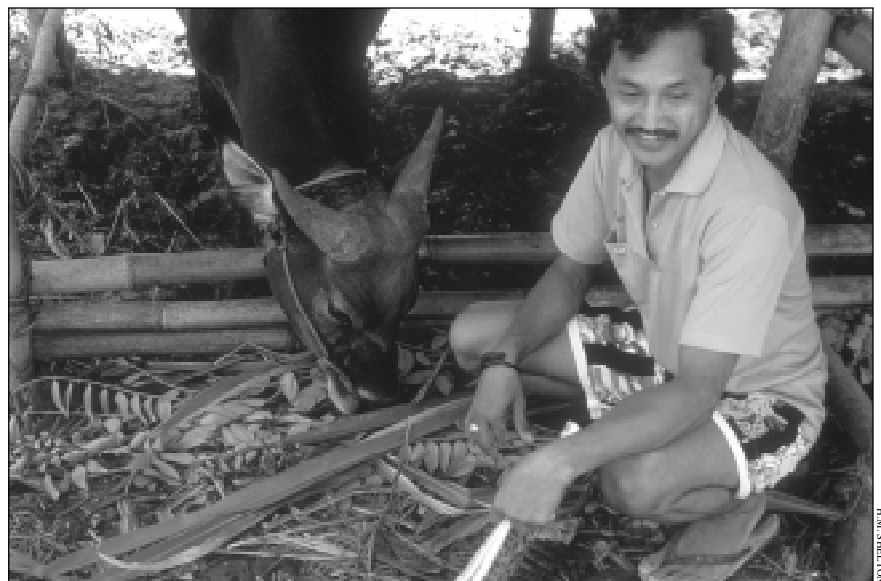
Petit exploitant nourrissant un buffle avec Gliricidia sepium à Bali (Indonésie)

L'hybridation, qui a lieu lorsque des taxons apparentés sont plantés à proximité, et qui est facilitée par les déplacements libres de semences dans les activités internationales de R & D, peut accroître le risque de mauvaises herbes (Hughes, 1998; Nouaille, 1992). Les essences peuvent devenir également une plante adventice dans leur propre environnement. Albizia tomentosa est une mauvaise herbe dans les régions détériorées du Mexique (Hughes et Pottinger, 1997) et Acacia aneura est souvent nuisible dans le sud-ouest du Queensland