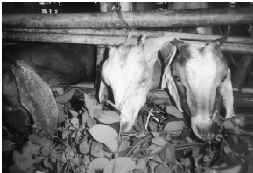
Chèvres nourries en étable avec Gliricidia (arbuste fourrager)

(Australie) lorsqu'elle est mal gérée (Beale, 1994).