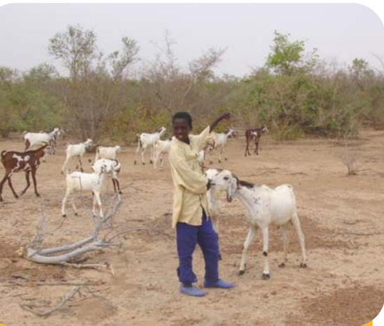
Jeune berger conduisant son troupeau dans un massif forestier aménagé pour la production de bois de feu au Niger.

L es dunes, collines et plateaux secs, souvent pierreux et peu cultivables, servent d'espaces collectifs pour le pâturage, la chasse ou la cueillette, en particulier de bois. Des bosquets et de petites forêts de bas-fonds sont parfois préservés autour des mares et en bordure de rivière. Quant aux agriculteurs, ils ont presque toujours conservé quelques arbres jugés utiles et pas trop gênants pour les cultures.