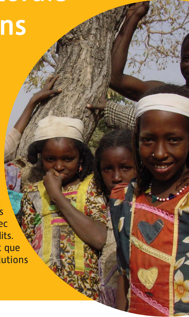
Enfants de berger Peul au pied d'un Karité.

A utrefois, la végétation naturelle des paysages sahéliens était constituée de savane arborée sur les reliefs et de différents types de forêts dans les vallées. Aujourd'hui, dans toutes les zones peuplées, la plupart des sols profonds ont été défrichés et mis en culture. La cohabitation des agriculteurs et d'autres usagers de ces espaces (éleveurs notamment), avec des intérêts parfois antagonistes, peut être source de conflits. Les chercheurs du Cirad, à travers différents projets, montrent que ces groupes peuvent s'organiser et trouver des solutions d'aménagement de l'espace qui optimisent les synergies.