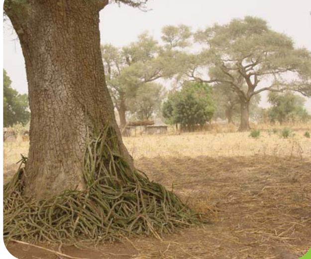
Les parcs à Faidherbia albida sont l'exemple parfait d'une association positive entre élevage, agriculture et récolte de bois.

Les espaces naturels sont progressivement appropriés par des organisations de bûcherons. C'est le cas au Niger et au Mali où le Cirad a contribué à mettre en place la politique de gestion locale des ressources naturelles et la création d'associations de bûcherons, les marchés ruraux de bois-énergie. Malheureusement, ces groupements excluent parfois les éleveurs, prétextant les dégâts du bétail sur les arbres, en particulier sur les rejets de souche après la coupe. Or les scientifiques ont montré que l'impact du bétail sur la survie et la croissance des ligneux sahéliens est très limité. Au contraire, le pâturage de saison des pluies s'exerce principalement sur la strate herbacée et limite les dégâts des feux de saison sèche sur les arbres. Enfin, les éleveurs sont des alliés objectifs des usagers des espaces forestiers contre les défrichements abusifs.