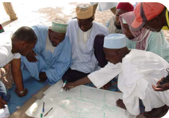
Discussion entre éleveurs et agriculteurs concernant la gestion commune du territoire dans un village du Nord-Cameroun.

Certains éleveurs se fixent partiellement et s'adonnent à l'agriculture. Dans le même temps, les agriculteurs acquièrent du bétail et revendiquent de plus en plus la propriété exclusive de leurs parcelles se réservant, notamment dans les régions densément peuplées, les chaumes et les produits des arbres pour leur propres animaux. Mais il existe encore des régions où les agriculteurs possèdent peu de bétail et des espaces agrosylvopastoraux restent sous-utilisés par l'élevage. Les arbres non émondés peuvent en outre y devenir gênants pour les cultures et être exploités. Il apparaît donc indispensable de