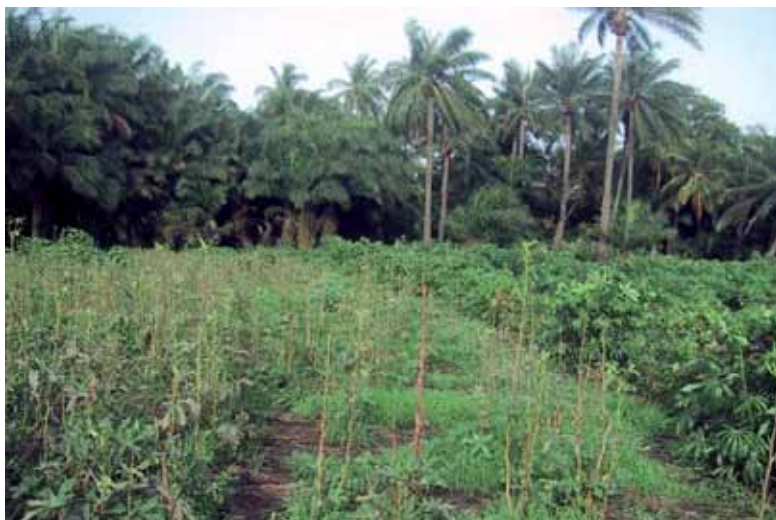
Gombo, manioc et palmier à huile dans la zone des Niayes, Sénégal.

Dans la région horticole des Niayes au Sénégal, les effets physiques (ombrage, humidité, température) des associations de cultures fruitières et maraîchères sur les communautés de ravageurs et de leurs auxiliaires sont mesurées directement chez les producteurs. L'Université de Dakar lance prochainement un master Ucad-Cirad en agro-écologie horticole fondé sur cette démarche.