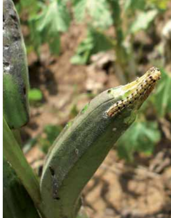
Helicoverpa armigera sur gombo.

Des bordures de plantes pièges, comme le maïs, sont également mises en place à l'extérieur des cultures pour optimiser la régulation biologique des populations de ces deux importants ravageurs. Ces travaux sont réalisés en partenariat avec des agriculteurs.