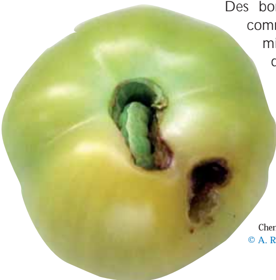
Chenille d' Helicoverpa sur tomate verte.

Dans les systèmes maraîchers antillais, des expérimentations sont conduites pour vérifier si les bordures de champ enherbées peuvent créer des habitats et fournir des ressources alimentaires pour les ennemis naturels de la noctuelle de la tomate ( Helicoverpa zea ) et de la pyrale des cucurbitacées ( Diaphania hyalinata ).