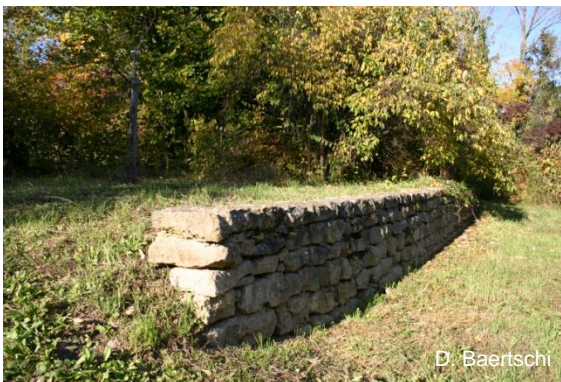
Mur de soutènement en pierres