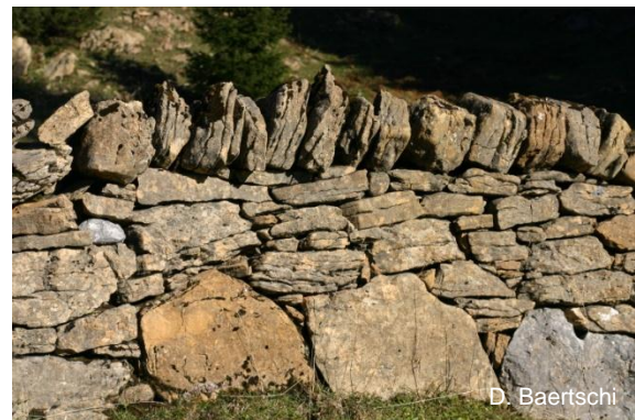
Détail de murs en pierres sèches