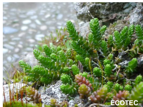
Orpin acre ( Sedum acre )