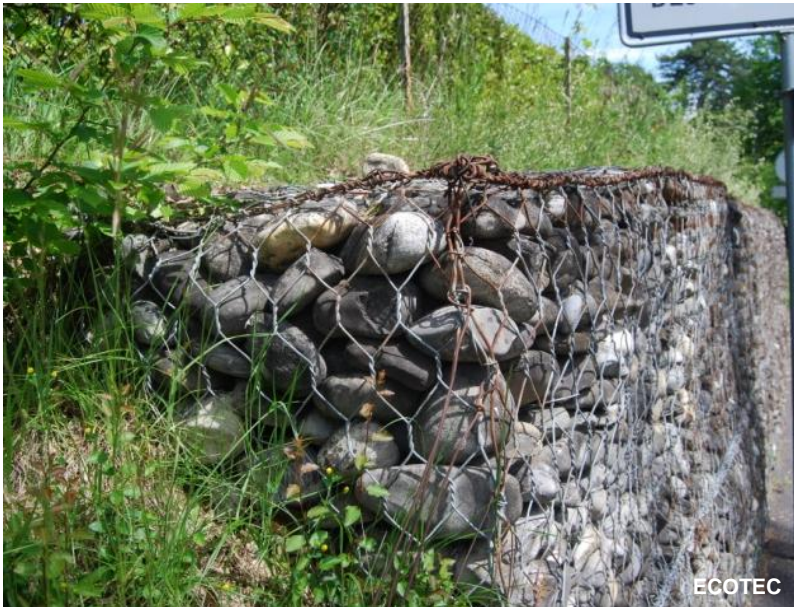
Gabion de soutènement en galets de rivière locaux (L'Arve)

Ainsi, un mur en gabions peut apporter une réelle plus value aux aménagements urbains et périurbains. Pour ce genre de réalisation, il faut se référer à des professionnels et utiliser des matériaux locaux.