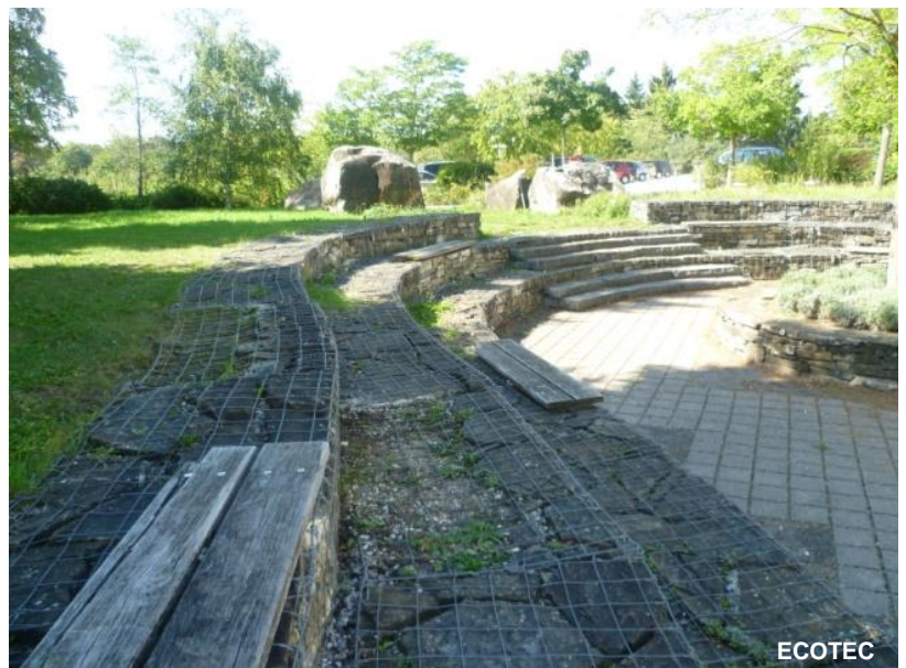
Aménagements en gabions colonisés par le lézard des murailles