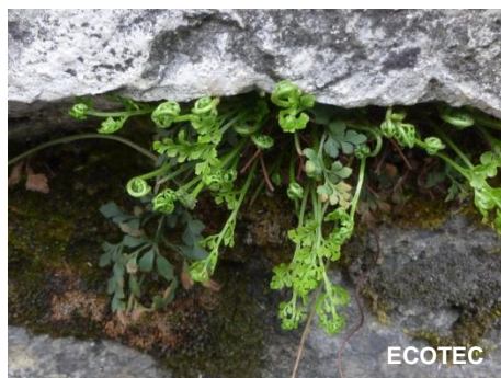
Asplénium Rue-des-murailles ( Asplenium ruta-muraria )