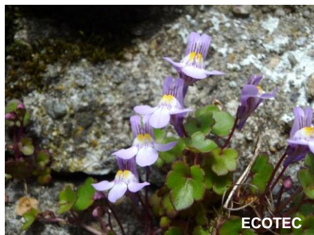
Cymbalaire des murs ( Cymbalaria muralis )