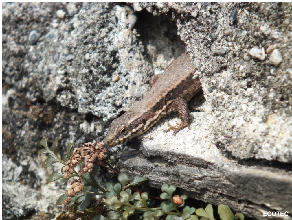
Lézard des murailles ( Podarcis muralis )