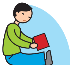
Manque de jeux imaginatifs