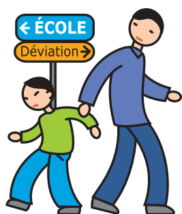
N'apprécie pas les changements