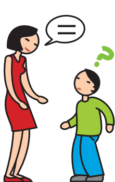
A du mal à comprendre et à se faire comprendre