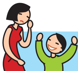
Rit de façon inappropriée