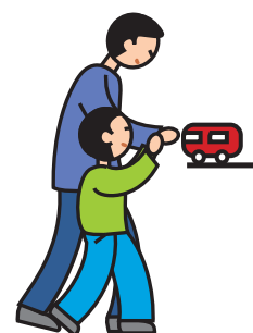
Indique ses besoins en utilisant la main d'un adulte