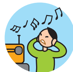
Peut être hypersensible aux sons, aux odeurs ...