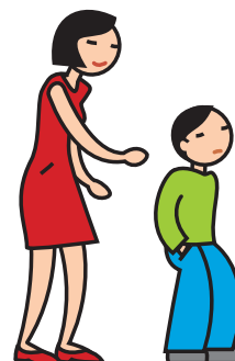
Manifeste de l'indifférence