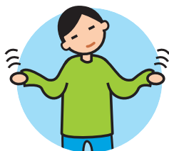
Présente des comportements bizarres