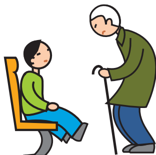
Comprend mal les conventions et les règles sociales