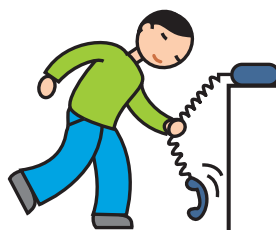
Utilise les objets de façon atypique