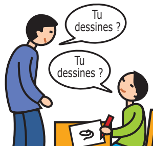
Utilise le langage de façon écholalique