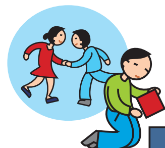
Ne joue pas avec les autres enfants