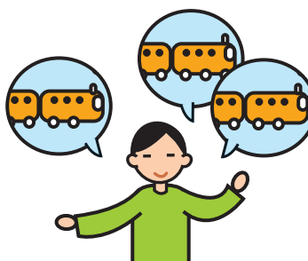
Parle de façon incessante sur un sujet particulier