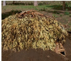
A trap used to catch termites