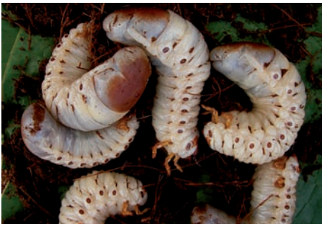
Larven van de Oryctes spp. Schildvleugelige, Dynastidae