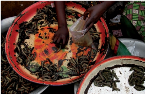
Several species of caterpillars