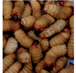
Coléoptère, Curculionidae Rhynchophorus phoenicis F.