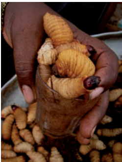
1000 FCFA (1.53€) for this glass in Cameroon