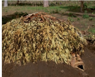
Piège utilisé pour capturer des termites