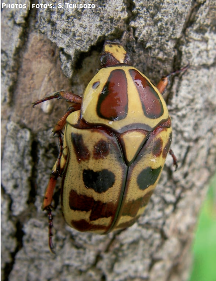
Coléoptère | Schildvleugelige | Coleoptera; Scarabaeidae Cetoniinae Pachnoda marginata aurantia

Pour plus d'informations visitez | Voor meer informatie, kijk op | For further information consult: http://gbif.africamuseum.be/lincaocnet et | en | and http://www.crgbbj.org/activites_en_cours_ou_executes.html