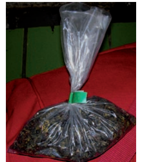
Een zakje dat in Parijs voor 2 euro verkocht wordt