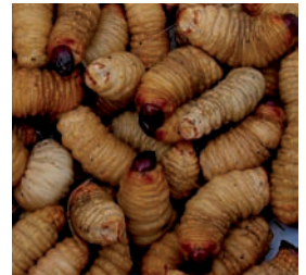
Schildvleugelige, Curculionidae Rhynchophorus phoenicis F.