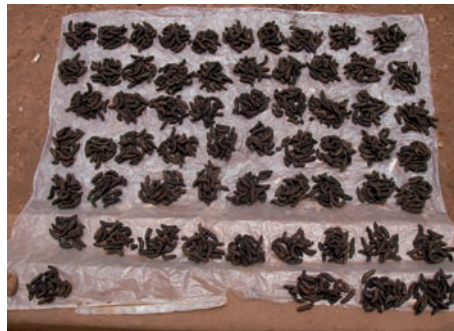
100 fCFA-frank (0,16 €) a pile in The Central African Republic