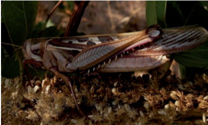
Orthoptère, Cyrtacanthacridinae Ornithacris turbida cavroisi (Finot, 1907)