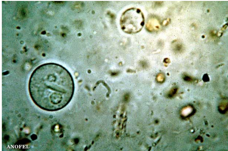
Photo : Entamoeba histolytica /dispar – kyste à 2 noyaux (eau formolée 10-15 µm)

Les deux noyaux, un seul est bien visible, entourent un corps sidérophile dont la forme en cigare est assez caractéristique d' E. histolytica . Les corps sidérophiles d' E. Coli sont généralement beaucoup plus fins et ressemblent à des aiguilles.