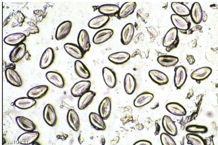
Photo : Scotch-test : Enterobius vermicularis (oxyure). Œufs embryonnés

La méthode de choix pour la mise en évidence des oeufs est d'utiliser la technique du ruban adhésif transparent (ou technique de Graham ou "scotch test") : le matin, de préférence avant la toilette et avant défécation, un fragment de ruban adhésif transparent est appliqué sur les plis radiés de l'anus préalablement dépliés. Le ruban est ensuite collé sur une lame pour être examiné au microscope. Les œufs sont incolores, asymétriques, ovalaires et mesurent 55 par 30 microm.