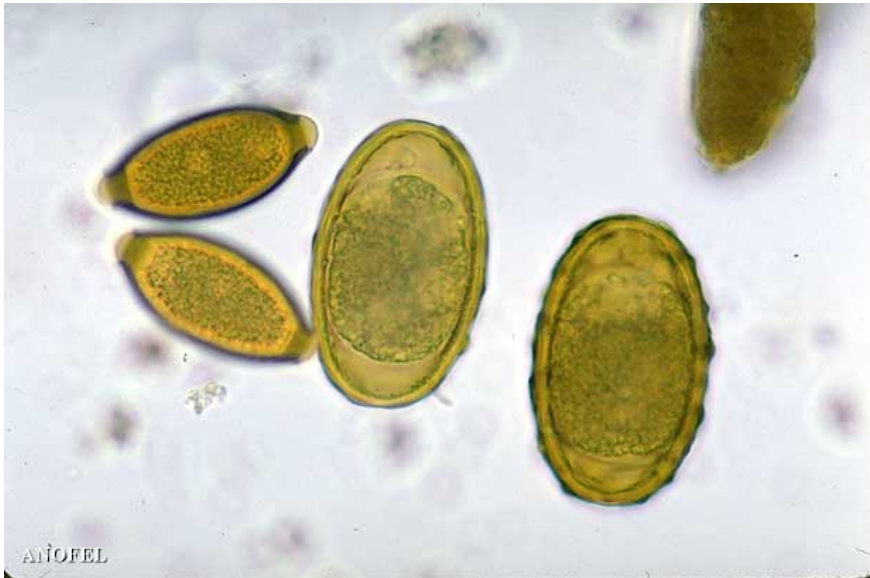
Photo : Trichuris trichiura (trichocéphale) et Ascaris lumbricoides – œufs

Ces deux types d'œufs de nématodes sont bruns, à paroi épaisse et non embryonnés. Ceux de T. trichiura ont deux bouchons muqueux aux extrémités. Ceux d' A. lumbricoides sont plus gros que ceux de T. trichiura , leur coque externe est épaisse et mamelonnée. (Parasitologie Mycologie. CHU Nancy.)