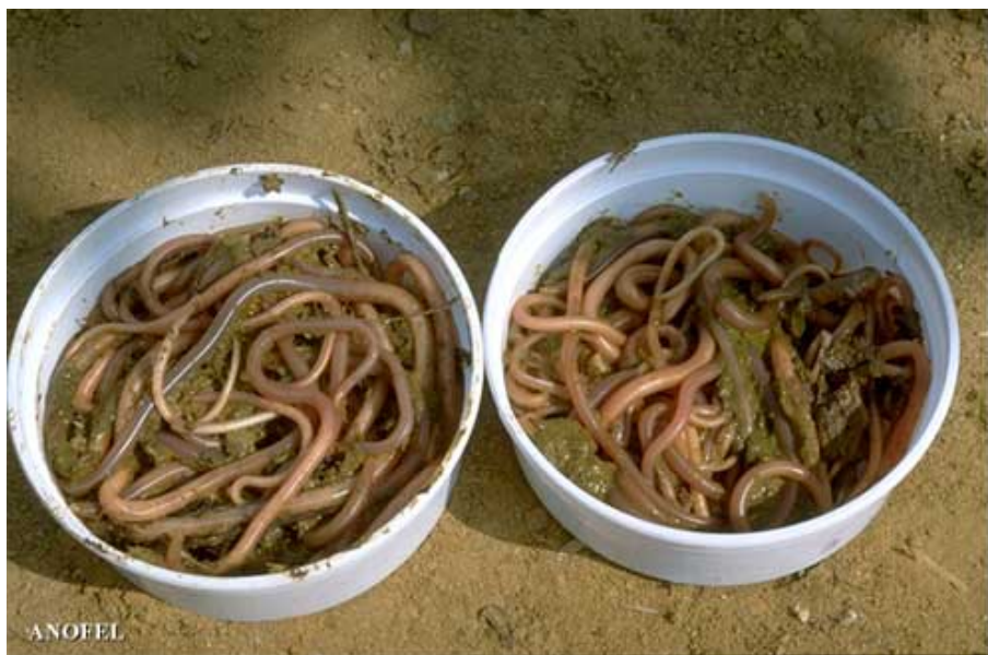
Photo : expulsion d'Ascaris lumbricoides après traitement par l'invermectine

Les larves d'ascaris peuvent éventuellement être retrouvées dans les expectorations accompagnées de cellules granuleuses éosinophiles.