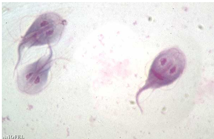
Photo : Selles : Giardia duodenalis – forme végétative (MGG 15x6 µm)

Tous les éléments caractéristiques de ce protozoaire sont présents : symétrie bilatérale, forme de cerf-volant, dépression réniforme faisant office de ventouse et contenant deux noyaux, corps parabasaux et 8 flagelles dirigés vers l'arrière, deux d'entre eux formant un faux axostyle.