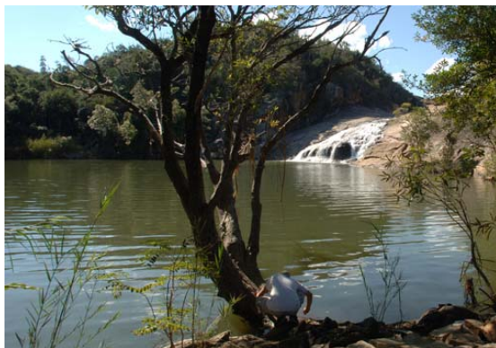
Etang au parc national d' Andohaela