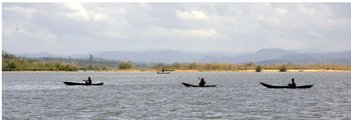
Fleuve Mangoro sur le niveau du canal de Pangalanes

On a construit un canal – Pangalana – le long de la côte Est qui mesure presque 600 Km (appelé aussi parfois Ampangalana ). ☺☺. Il est naturel, car l'Océan Indien inonde toujours la région côtière et amasse des dunes de sables . Des grandes et petites lagunes et lacs se forment derrière le canal. On appelle en malgache vinany le débit des fleuves à travers les lagunes. Pendant la période de la colonisation française, le canal de Toamasina vers Farafangana était accessible sans interruption. De nos jours on peut utiliser une partie du canal de Tamatave jusqu'à Vatomandry (2 – 4 jours de voyage) en naviguant avec bateau. Des hôtels sont nés au bord des lacs et le long du canal. La location des bateaux est si chère que les touristes renoncent à un tour sur le Pangalana. Le circuit Est de DILAG – TOURS conduit à travers le Pangalana. On peut aussi rajouter une traversée sur le Pangalana à un grand circuit nord ou à un programme complémentaire Tamatave .