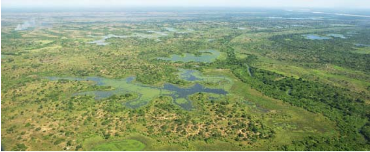
Vue aérienne du lac près de Bekopaka