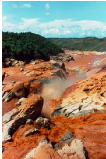
Betsiboka lors d'une crue