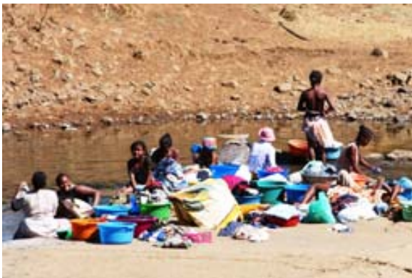
Femmes et enfants en train de laver