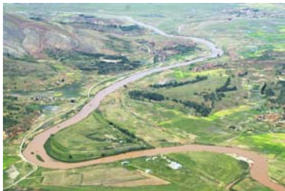
Vue aérienne de l'Ikopa vers Tana