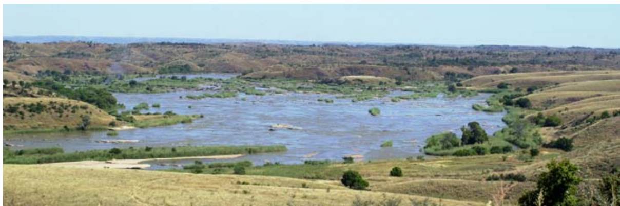
Fleuve Ikopa peu avant Maevatanana au mois de Mai