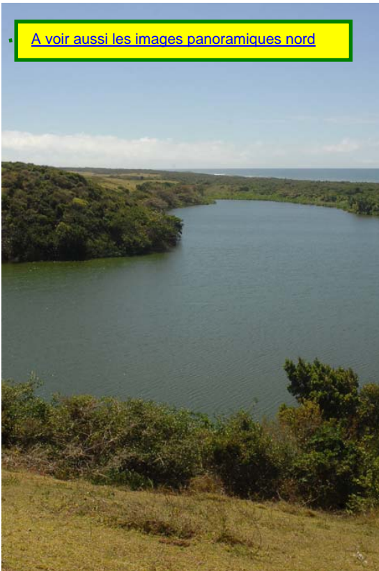
Lac Vert derrière la côte au Sud de Vohémar

• A voir aussi les images panoramiques nord