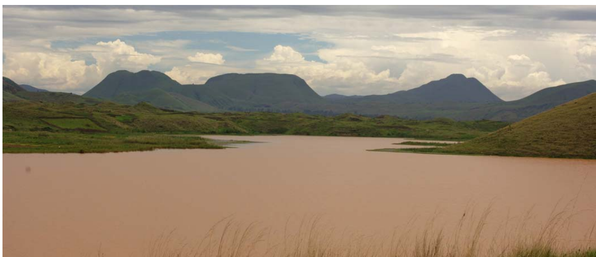
Lac derrière le geyser à Analavory