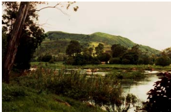
Flux du Lac Itasy dans le Lac Ampefy