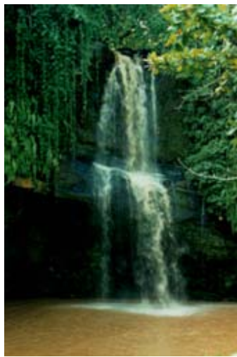
Chute d'eau à Nosy Be