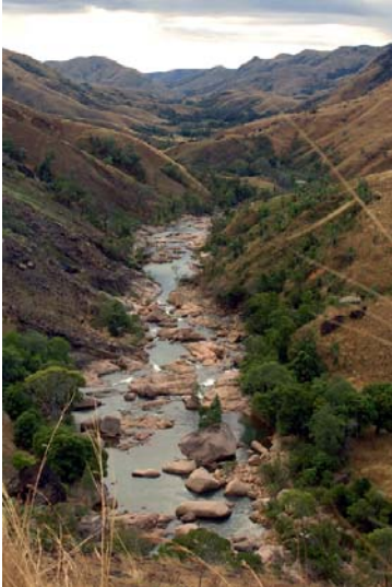
Ruisseau à la vallée de Bealanana