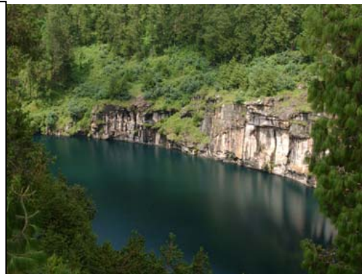
Lac volcanique Tritri à Antsirabe