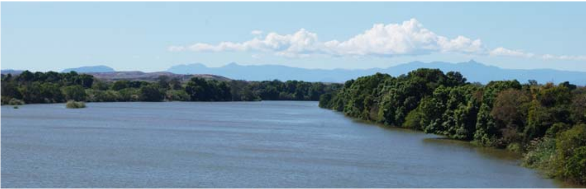
Fleuve Ankofia à la RN 6 vers Antsohihy