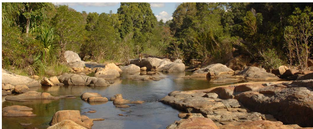
Fleuve qui coule à travers le parc national Andohaëla