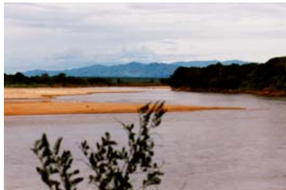
Fleuve de Mandrare près du Berenty-Parc