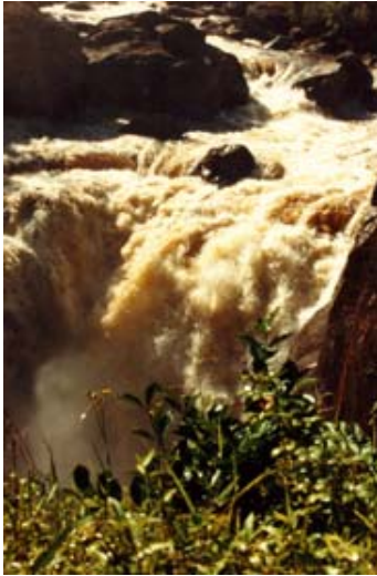
Chute d'eau de Namorano à Ranomafana