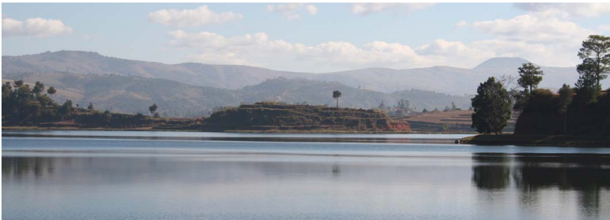
Lac d' Andraikiba à Antsirabe , qui est aussi le réservoir d'eau potable de la ville

Fleuves, lacs, étangs mais aussi eau souterraine sont les sources pour l'alimentation en eau potable du pays. Seulement une partie de la population ont accès à l'eau potable sans avoir de problème. Il n'existe aucune canalisation pour se débarrasser des eaux usées et pour les traiter.