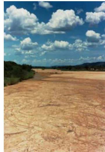
Fiherenana pendant la saison sèche