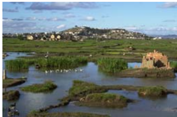
Etang avec fabrications de briques en dehors de Tana