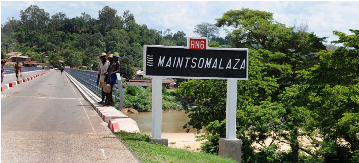
Panneau du nom d'un fleuve à Maromandia