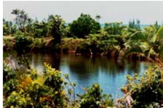
Canal Ampangalana à Tamatave