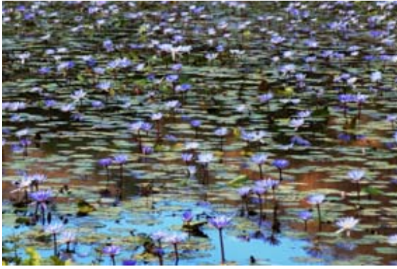
Lac avec des néuphars à la RN 5a