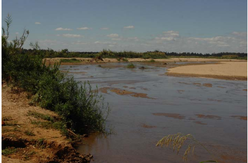
Fleuve à la RN 6 à Mampikony

• A voir aussi les images panoramiques nord