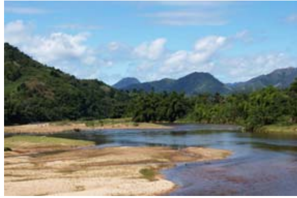
Fleuve Lokoro à la RN 3b vers Andapa