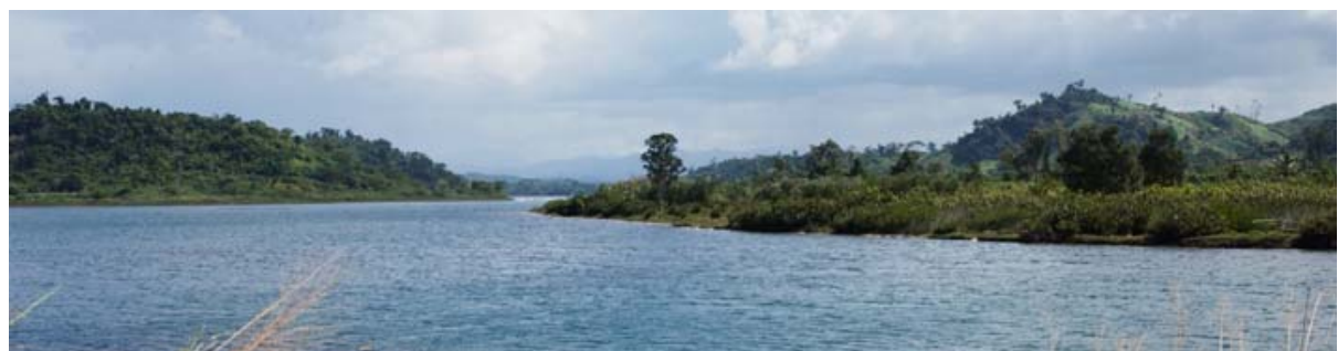
Embouchure et lagune à la RN 5a peu avant Antalaha