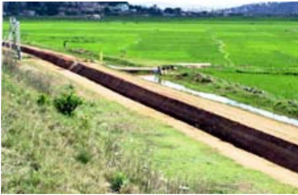
Canal pour l' irrigation à Tana