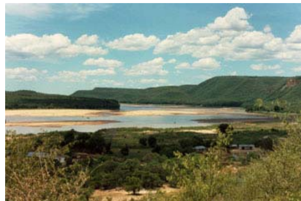
Fleuve Onilahy sur le transversal Sud