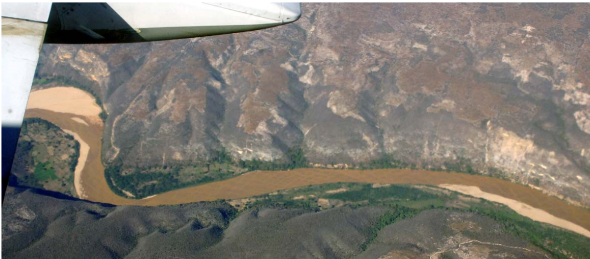
Vue aérienne du fleuve Fiherenana au Nord Est de Tuléar