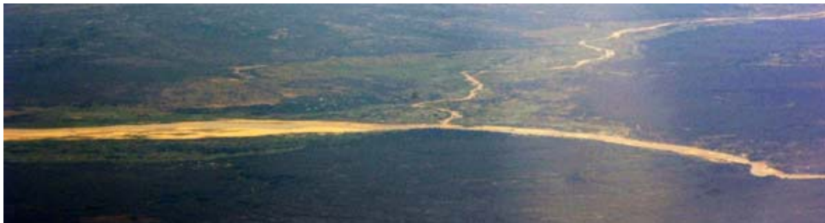
Onilahy à l'embouchure du Taheza à Bezaha et...