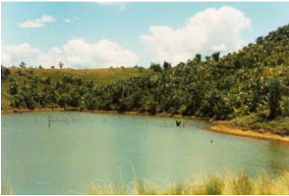
Lac au bord de la route Iroandro vers Manakara