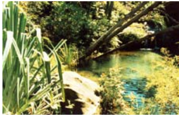
Etang au mont de l'Isalo