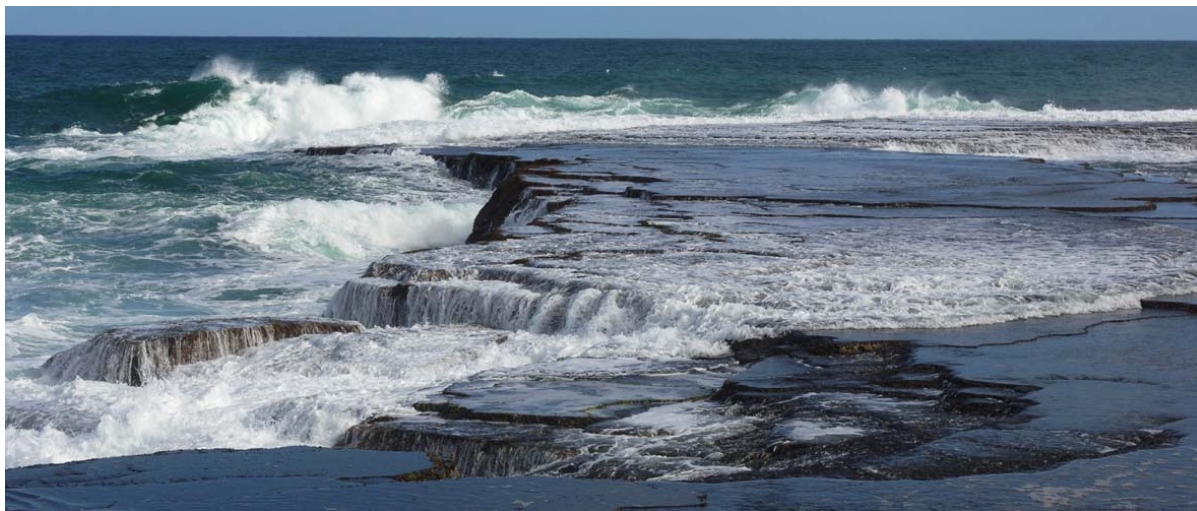
Mer au Cap Sainte Marie