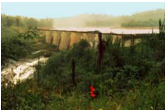
Barrage de Tsiacompaniry