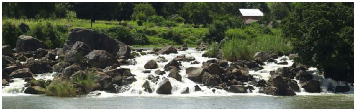
Chute d'eau au Lac Ampefy