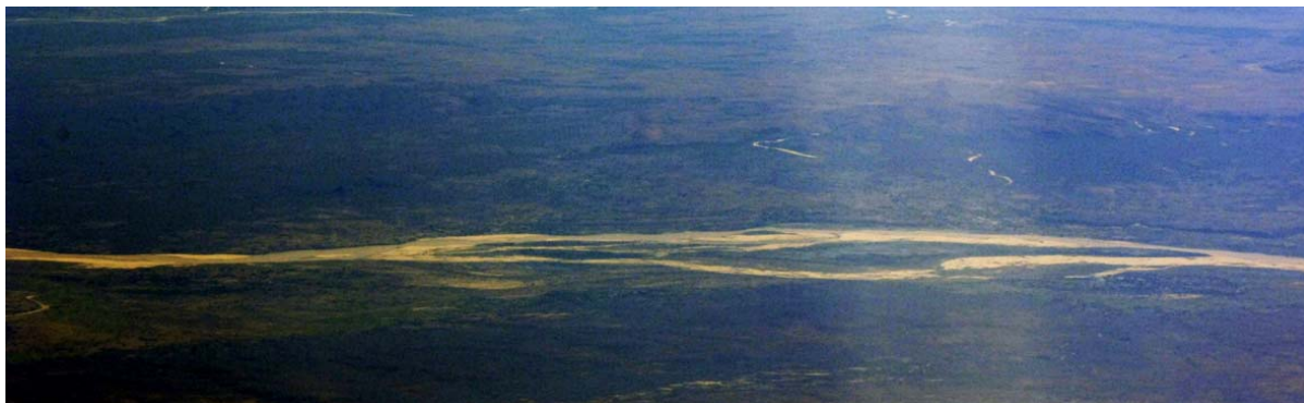
...encore à l'Est, ce qu'on appelle les vaines du Sud