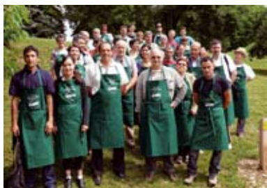
Les guides composteurs : des bénévoles qui se mobilisent et se forment pour informer leurs concitoyens et mener à bien des opérations de compostage domestique et semi-collectif.

• une bonne organisation et implication des participants pour une mobilisation durable autour de l'opération. Il est en particulier important d'avoir une personne référente (guide-composteur) qui ait bénéficié d'une formation pratique au compostage (toujours la même personne ou mise en place d'un tour de rôle). Elle sera chargée de la bonne marche de l'opération (Accompagnement dans la durée des participants, conseils, rappel et respect des consignes, suivi du compostage, animation, contact avec les participants...);