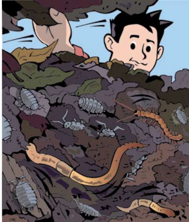
Un signe que votre compost se porte bien : il héberge de nombreux habitants tels que cloportes, vers de terre, myriapodes...

Toutefois, la montée en température reste insuffisante pour garantir une hygiénisation totale et la destruction des graines. On peut limiter les risques en évitant d'y mettre des végétaux malades ou des mauvaises herbes en graine car le compost pourrait alors permettre leur propagation.