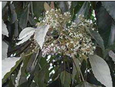
Fleurs d' Aleurites moluccana.