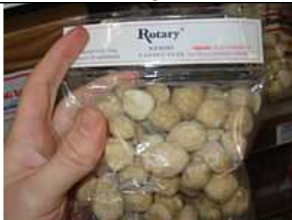
Candlenuts (kemiri) de l'Indonésie.