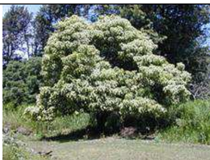
Aleurites moluccana.