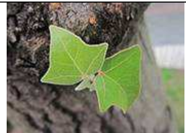
Les jeunes feuilles montrant leur caractère poilu.