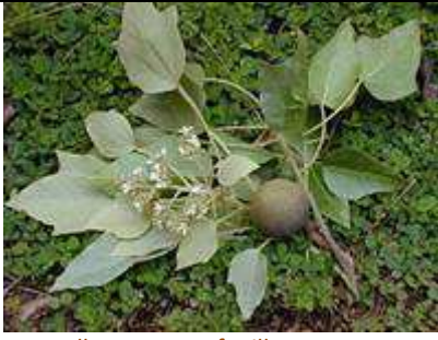
Nouvelle pousse et feuilles tomenteuses blanc-brillant [En Anglais « New growth and leaves are frosty-white tomentose »]. Source : Margaret Barwick, Tropical & subtropical tree .