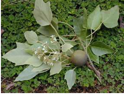
Fruit et feuilles.