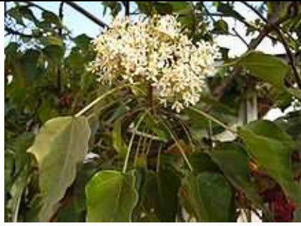
Détail des fleurs.