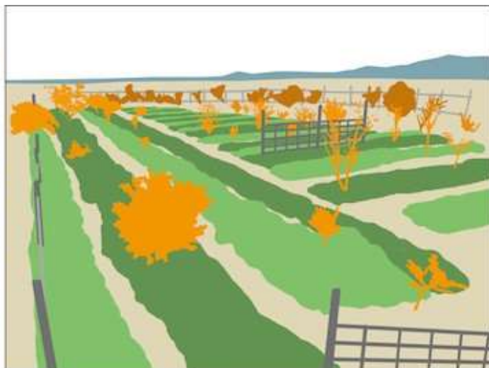
■ Surface productive ■ Arbre fruitier ■ Palissage pour les plantes grimpantes

Images 3 et 4. Champ expérimental de la synécoculture sur la surface de 1000 m 2 à Issé, Japon. Il se compose des surfaces productives surélevées de 30 cm, des passages pour la récolte et le maintien, des arbres fruitiers de 1-3 m, et les palissages autour du champ pour les plantes grimpantes (Photo prise en fin novembre 2010).