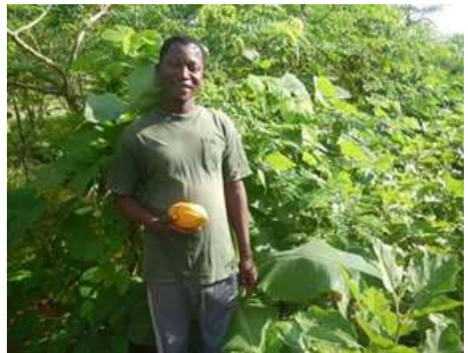
Image 1. a) Zone de démonstration de la synécoculture, après 18 mois d'installation, à Fada N'Gourma, à gauche (7 Sep 2016, angle B). b) Zone témoin comme contrôle, à droite (17 Nov 2016, angle D).