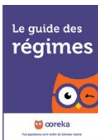
Le guide des régimes