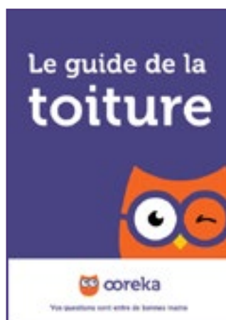
Le guide de la toiture