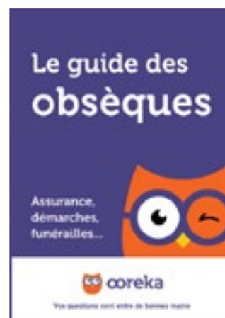
Le guide des obsèques