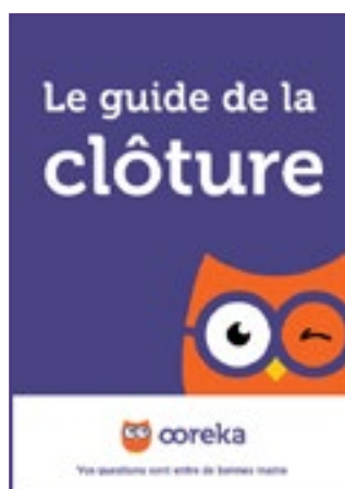
Le guide de la clôture