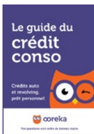
Le guide du crédit conso