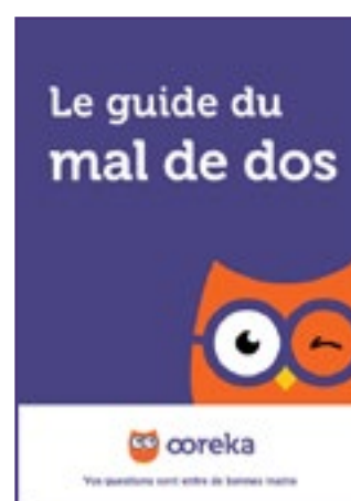
Le guide du mal de dos