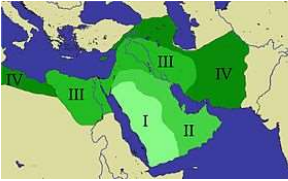
Expansion arabe sous Mahomet (I) et les trois premiers califes, Abou Bakr (II), Omar (III) et Uthman (IV).