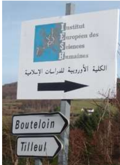
Institut Européen de Sciences Humaines.

Or sur ce panneau concernant le centre des formations des imams de l'UOIF, il est écrit, en français, « Institut européen des sciences humaines » (IESH), tandis qu'il est écrit en arabe « institut européen d'études