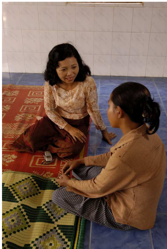
Une vie après l'exploitation: écoute, soutien et accompagnement à la réinsertion

La proximité, le contact et la création d'une relation solide avec les enfants vulnérables est l'une des priorités de notre action : les équipes de World Vision vont tous les jours à la rencontre des enfants des rues, les informent, gagnent peu à peu leur confiance, et leur offrent un abri sûr, où ils peuvent être nourris, soignés, et trouver de quoi se divertir.