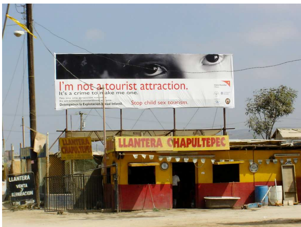
Au Mexique, World Vision a installé de grands panneaux de sensibilisation

Au Brésil, la région du Nordeste est l'une des principales destinations pour le tourisme sexuel et la période du Carnaval attire beaucoup d'étrangers. World Vision Brésil a mené une campagne contre le tourisme sexuel dans huit grandes villes touristiques brésiliennes : São Paulo, Rio, Belo Horizonte, Recife, Fortaleza, Salvador, Belém et Manaus. Cette campagne visait à mieux faire comprendre le phénomène du tourisme sexuel, préalable indispensable pour le combattre : obtenir le soutien des populations, sensibiliser la police locale et améliorer l'écoute des victimes. Elle a duré 6 mois.