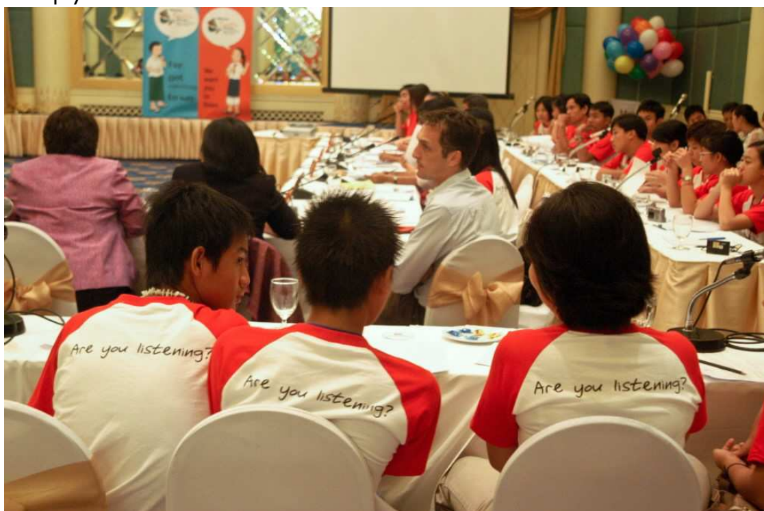
Les enfants sont consultés et impliqués dans la défense de leurs droits

La Convention relative aux droits de l'enfant est le texte de droit international le plus ratifié au monde. Seuls deux pays, les Etats-Unis et la Somalie, ne l'ont pas signée. Les pays qui l'ont ratifiée s'engagent à lutter contre toute forme d'exploitation sexuelle et commerciale, afin d'éviter l'exploitation à des fins de prostitution et de production de matériel pornographique. En 1999, la Convention 182 de l'OIT a inclus l'exploitation sexuelle et commerciale des enfants dans l'une des pires formes de travail des enfants. 165 pays ont ratifié cette convention : l'exploitation sexuelle et commerciale des enfants est interdite dans tous ces pays.