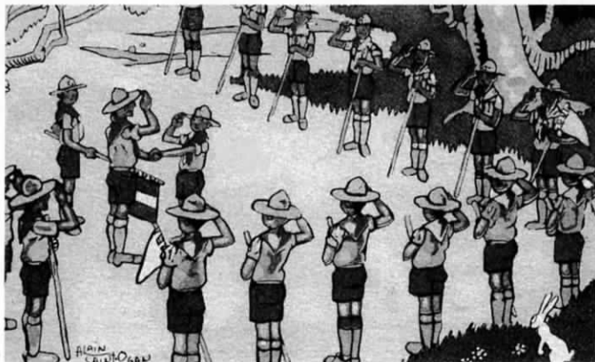
Une cérémonie que le Maréchal Pétain aurait bien aimé organiser lui-même, en imposant francisque et bras levé.