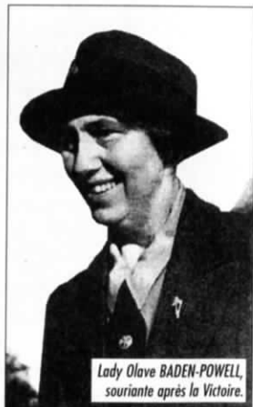
Lady Olave BADEN-POWELL, souriante après la Victoire.