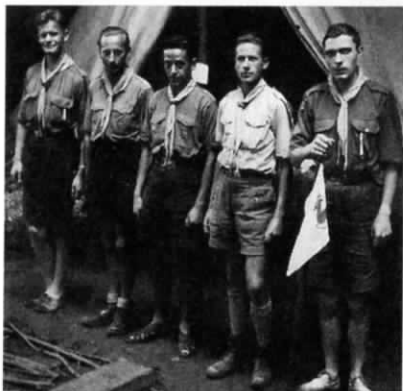
Chefs en patrouille à Cappy enfin retrouvés.