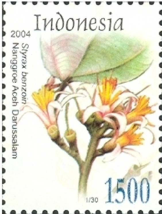
En sello postal de Indonesia

Styrax benzoin , es una planta de la familia Styracaceae original de las islas de Sumatra, Java y Borneo. [1][2]