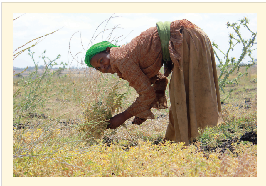
Figure 3. Paysanne récoltant manuellement du pois chiche en Éthiopie.

La sélection et la production de cultivars plus productifs et résistants n'auront cependant qu'un impact limité si ces efforts ne sont pas conjugués à d'autres initiatives sur le terrain pour encourager l'adoption des légumineuses par les paysans. Il faut pour cela comprendre les différents déterminants socio-économiques et culturels de la production, consommation et commercialisation de légumineuses au niveau des communautés paysannes. Les légumineuses à graines peuvent nécessiter une plus grande charge de travail (désherbage, récolte) par rapport aux céréales (Snapp et al. , 2002 ; Snapp et Silim, 2002). Les légumineuses sont en majorité cultivées par les femmes. Ainsi l'arachide est dite « culture de femme » dans certains pays d'Afrique de l'Ouest comme au Mali où 85 % de la surface en arachide sont cultivés par des femmes, qui sont aussi largement impliquées dans les activités de préparation culinaire de ces cultures. Étant donné l'accès plus limité aux intrants agricoles qui touche les femmes, une intensification des cultures légumineuses est moins aisée que pour les céréales. Les légumineuses à graines sont souvent présentées comme une source protéique bon marché, il peut y avoir des préjugés négatifs liés à leur consommation. Réduire les pertes de stockage en mettant à disposition des paysans des