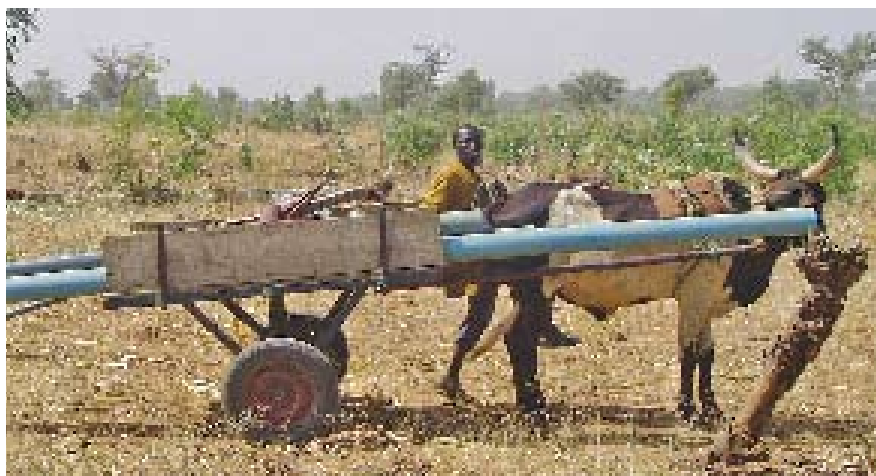
Transport de matériel de forage à la tarière par char à bœufs.

« Il est vraiment indispensable de faire la démonstration de la technique à l'agriculteur... Il faut d'abord repérer les personnes intéressées et aller vers elles. Ce sont les villageois qui doivent sensibiliser les autres, [parce que]