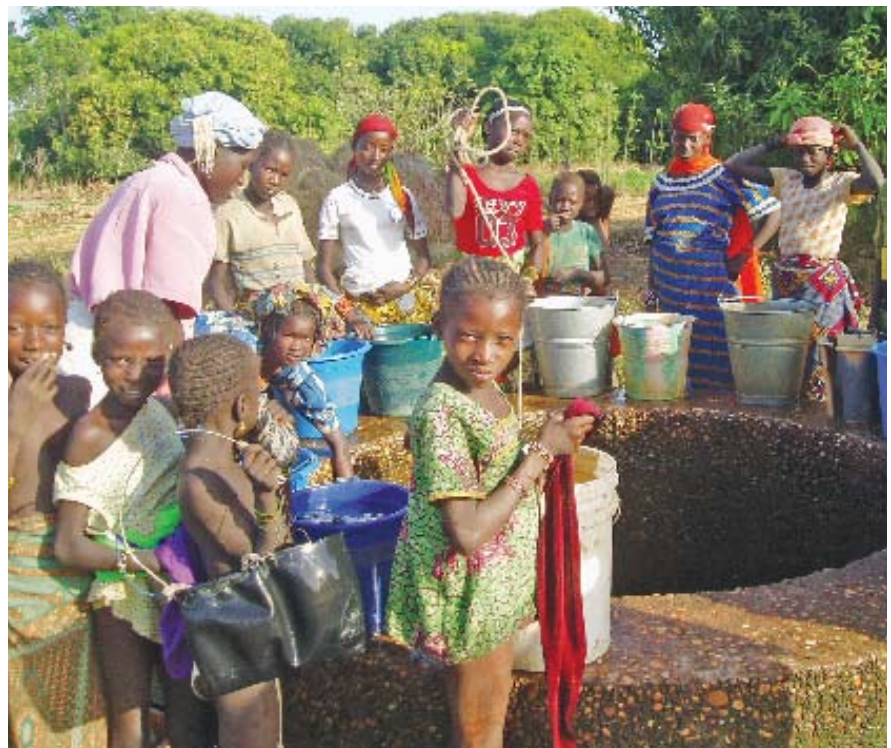
Collecte de l'eau à un puits bordé d'une margelle en ciment.

La politique gouvernementale pour les zones rurales consiste à fournir un point d'eau moderne pour 250 personnes. La responsabilité de l'entretien incombe aux usagers, chaque région ayant sa propre méthode pour assurer la viabilité des pompes. L'approvisionnement en pièces pour ces dernières s'est révélé problématique.