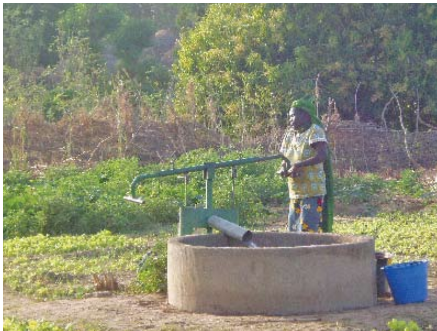
Femme actionnant une pompe manuelle à Karra.