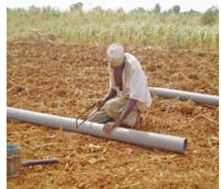
Découpage de filtres pour puits sur le terrain.

peu profondes partout dans le pays. Dans les vallées, où se situe l'essentiel des activités agricoles, la surface de la nappe est généralement élevée. Les intervenants de l'État, les organisations non gouvernementales et les organismes bailleurs de fonds distinguent généralement l'eau potable (pour l'eau de boisson) de l'eau destinée aux cultures et aux animaux. Il est douteux que les villageois établissent cette distinction, et les agriculteurs boivent généralement l'eau de leur puits. Certains préfèrent boire l'eau d'un « tuyau d'irrigation » plutôt que celle d'un puit creusé à la main revêtu de ciment, tandis que d'autres rapportent chez eux l'eau des « puits d'irrigation ». De nombreux intervenants se disent inquiets de la qualité de l'eau potable et de la quantité ou de la viabilité des eaux à usage agricole provenant des nappes souterraines peu profondes. De nombreux professionnels pensent que les dépôts sablonneux superficiels, qui recèlent la majeure partie des eaux souterraines peu profondes au Niger, contiennent de l'eau sale non filtrée.