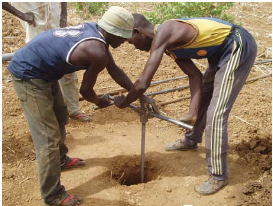
Forage manuel au Niger de nos jours.

Il a permis à la tarière de s'imposer dans certaines parties de la région. Le directeur du Projet pour la promotion de l'irrigation privée II à Maradi raconte : « Quand je suis arrivé, en novembre 1991, il existait 91 puits forés [à la main] dans les districts de Madaoua et de Bouza [tous deux dans la vallée de la Tarka]. En décembre 1997, on en comptait plus de 2 600. » Ces puits ont été forés par des entreprises locales au profit des agriculteurs.