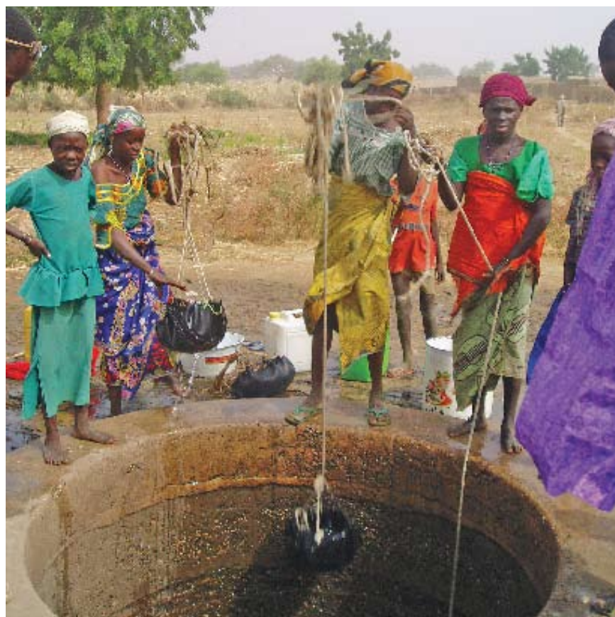
Puisage d'eau dans un puits revêtu de ciment.

Enfin, les inquiétudes concernant la qualité de l'eau et les ressources hydriques méritent des études détaillées, qui tiendront compte du fait que la population tire souvent l'eau de boisson et l'eau d'arrosage de la même source d'approvisionnement. Le potentiel de contamination des eaux souterraines peut être profond par le rejet d'excréments, les engrais et les pesticides doit être minutieusement examiné. En cas de développement de l'utilisation des pompes motorisées, le risque de surexploitation et d'épuisement des eaux souterraines doit être analysé.