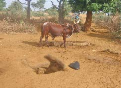
Puits traditionnel creusé à la main et bordé d'une margelle en bois.