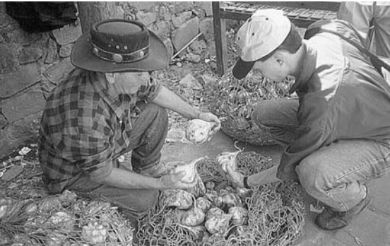
La Jicama ( Pachyrhizus erosus ) est une culture vivrière pouvant également servir comme culture de couverture.

100.000 hectares. D'autre part, les ev/cc sont également utiles aux paysans à faibles ressources, à condition qu'ils aient suffisamment de terre pour permettre l'incorporation des ev/cc sans affecter le système normal de culture. Si les paysans ont suffisamment de terre pour pratiquer les cultures alternantes avec de longues périodes de jachère, ils pourraient ne pas s'intéresser aux ev/cc.