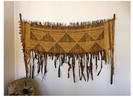
Musée africain de Gunsbach- Natte en palme inachevée.

La natte pour s'asseoir, posée à même le sol, constitue le parti le plus répandu de la Période des Royaumes combattants et à l'époque Han. En général rectangulaires, les nattes peuvent être en jonc parfois lié par des cordons de soie de couleurs, en bambou ou en branchettes de pêcher. Elles sont le plus souvent bordées d'une ganse de tissu ordinaire ou de soie peinte ou brodée, dans l'esprit des tatami japonais. Comme c'est encore le cas pour ceux-ci, la natte, à l'époque Han, sert d'étalon de longueur pour les salles, et il semble que les dimensions des plus communes sont assez proches de celles du tatami actuel.