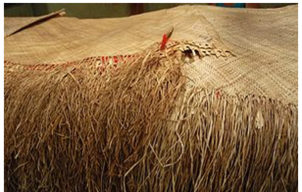
'ie toga ( en ) des, îles Samoa.