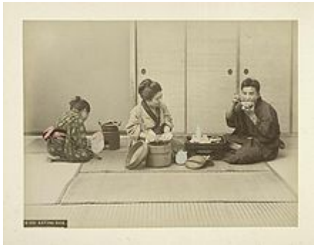
Intérieur traditionnel japonais et tatami.

Au Japon , toutes les chambres sont garnies de nattes rembourrées toutes exactement de la même taille en sorte qu'on n'a jamais de peine à les placer dans un appartement. Chaque natte (ou tatami ) a six pieds trois pouces de long trois pieds deux pouces de large et est épaisse de quatre pouces. Elles sont faites de paille de riz ou de blé tressée très serré. La natte est devenue par conséquent une mesure courante au Japon en sorte que les chambres peuvent s'agrandir ou se rapetisser à volonté en faisant glisser les paravents. Les nattes étant petites et légères, l'ameublement d'une maison n'est pas une entreprise fort compliquée.