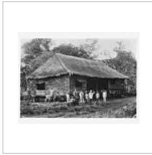
Natte et hutte Nipa, Philippines.