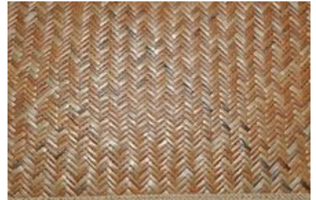
Natte en Jonc. Calcutta, Inde.

Une natte est un ouvrage de vannerie , tissu de paille, de jonc ou de bambou servant à couvrir les planchers ou à revêtir les murs des pièces d'habitations. C'est un article traditionnel dans beaucoup de pays orientaux et qui remplace fauteuils, chaises et lits. Les nattes rentrent aussi dans diverses traditions constructives.