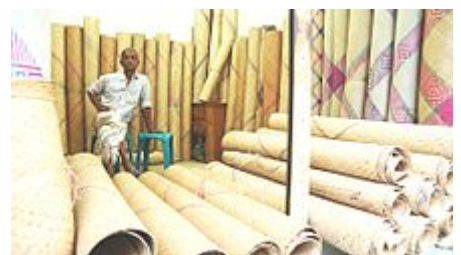
Shital Pati , nattes de jonc, Dacca, Bangladesh.

Au Tonkin , au xix e siècle, les sièges sont formés chez les gens du commun par une natte étendue sur la terre et chez les riches par de petites estrades couvertes d'un tapis et qui sont plus ou moins élevées selon le rang des personnes auxquelles on y fait prendre place. Les lits sont aussi composés de nattes avec des oreillers formés d'un tissu de jonc. Du reste les appartements sont dépourvus de meubles.