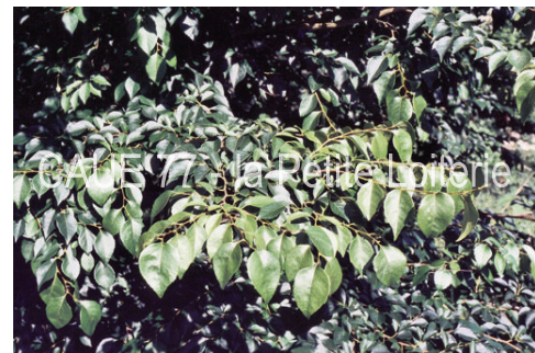
Feuillages (6 à 8 cm)