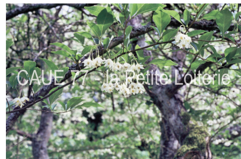
Clochettes groupées par 3 à 6