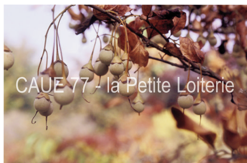
Fructification globuleuse (1,5 cm)