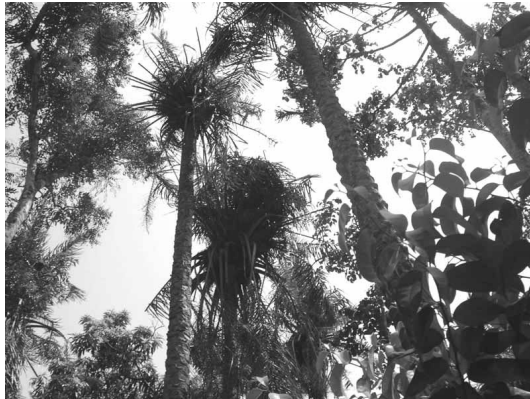
Figure 2.— Nids de chimpanzés établis au sommet des Elaeis guineensis dans une forêt-galerie de Kanfarandé.

A cette utilisation remarquable du palmier à huile par les chimpanzés s'ajoute la consommation de la moelle des jeunes feuilles dont nous avons observé les traces. Les rachis dont l'extrémité a été mâchée, ainsi que des inflorescences mâles avec un pédoncule délité jonchent le sol aux alentours des palmiers.