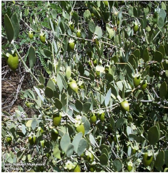
Feuillage et fruits de Simmondsia chinensis

Les graines encore appelées « amandes » ou « fèves » sont de la taille d'une olive et on les récolte à l'automne. On en extrait l'huile de jojoba, une sorte de cire liquide comparable au sébum et qui ne rancit pas. Cette huile est utilisée dans l'industrie des cosmétiques pour diluer les huiles essentielles, en remplacement du blanc de baleine. Elle est aussi appréciée comme huile de massage, car elle pénètre facilement la peau et ne laisse pas de sensation de gras, ou encore pour la lubrification des moteurs et l'alimentation des lampes pour l'éclairage.