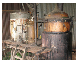
Alambic municipal de Cussay en France