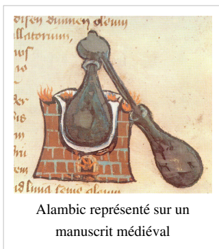
Alambic représenté sur un manuscrit médiéval