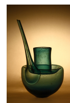
Alambic perse du , Tabriz