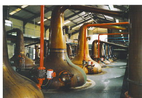
Alambic charentais de la distillerie Glenfiddich en Écosse