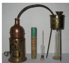
Alambic de mesure du degré alcoolique du vin