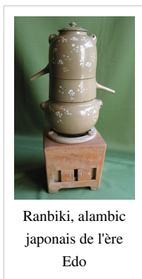
Ranbiki, alambic japonais de l'ère Edo