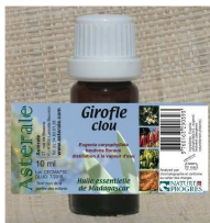
Huile essentielle de Girofle clou 6.30EUR