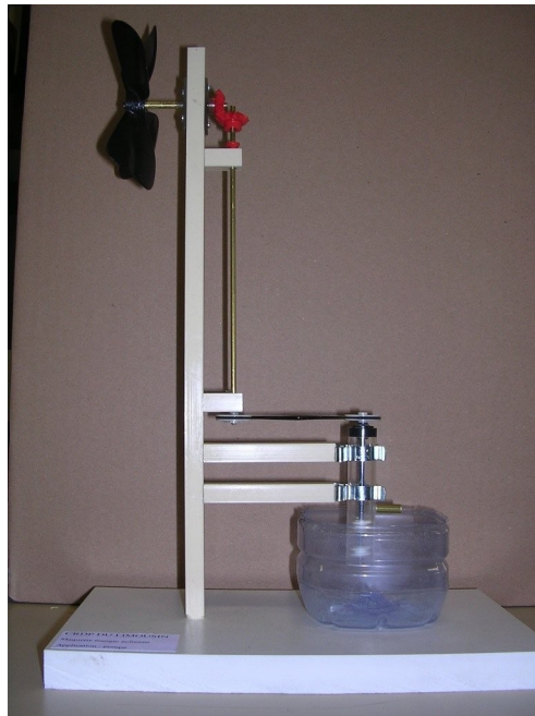
Photographie non contractuelle