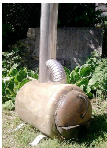
Le four à base de chauffe-eau de récupération