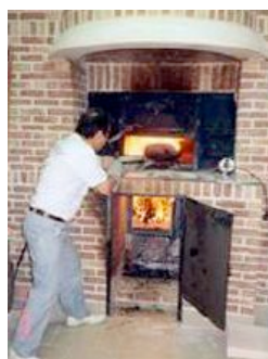
Le four à gueulard