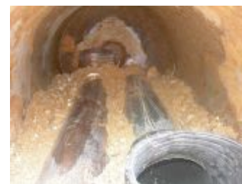
Intérieur du four à base de chauffe-eau