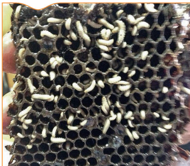
Figure 1. Morceau de couvain infesté de larves d' Aethina tumida , provenant d'un des nuclei présent dans le premier foyer. Un nucleus est une petite colonie d'abeilles de quelques milliers d'individus contenus généralement dans une ruchette. Le cliché a été pris le 5 septembre 2014

Le petit coléoptère des ruches ( Aethina tumida Murray 1867; Coleoptera: Nitidulidae) est un insecte originaire d'Afrique subsaharienne. Il a été identifié pour la première fois au Nigeria en 1867 (Lundie, 1940). À l'occasion d'échanges internationaux, il a été introduit et s'est installé aux États-Unis en 1996. Des cas d'introductions ont également été recensés dans différentes régions du Canada (2002, 2006 et de 2008 à 2012), en Égypte (en 2000 sans avoir jamais été ré-identifié depuis), en Australie près de Sydney (2002) et dans certains pays d'Amérique centrale: Mexique (2010), Cuba (2012), Salvador (2013), Nicaragua (2014) (OIE, 2014). En Europe, l'unique cas d'introduction a été notifié par le Portugal en 2004