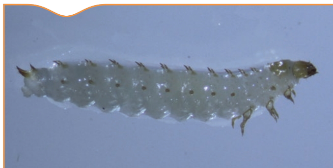
Figure 2. Larve d' Aethina tumida mise en évidence le 5 septembre dans le premier foyer découvert; longueur: environ 1 cm