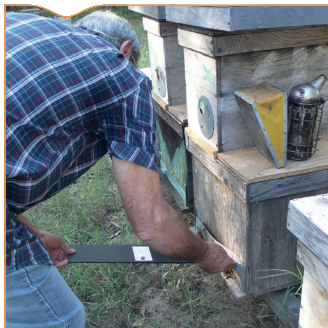
Figure 6. Mise en place de pièges dans les ruchers situés dans la zone de protection en Italie (septembre 2014)

membres pour une maîtrise rapide et efficace de ce danger. Au vu des caractéristiques du cycle biologique du petit coléoptère, il est de plus fortement probable que les pays situés dans les zones à climat chaud de l'Europe rencontreraient plus de difficultés dans le contrôle de ce ravageur des abeilles que ceux ayant un climat plus froid.