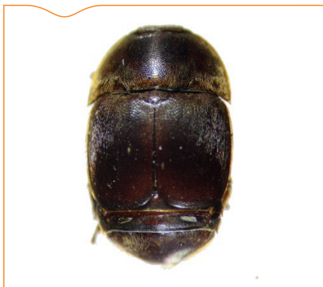
Figure 3. Aethina tumida , forme adulte; longueur: 6-7 mm

(Murilhas, 2004) où le foyer a été rapidement détruit. Il s'agissait de larves et d'œufs présents dans des cages à reines importées du Texas. La destruction très précoce des colonies concernées avait permis d'éviter la propagation de ce parasite. Depuis, aucun nouveau cas de détection d' A. tumida n'avait été déclaré en Europe.