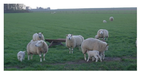
Les brebis texels sont réputées pour leurs qualités maternelles.

Le texel est un excellent producteur de viande et de laine. C'est une race bien conformée et qui comporte peu de gras et a un excellent rendement de carcasse. C'est pourquoi elle est appréciée en croisements pour améliorer les aptitudes bouchères de brebis à la conformation moindre. Les femelles sont prolifiques (en moyenne 1,73 agneaux par portée) et bonnes laitières. Elles permettent d'assurer aux agneaux une bonne croissance, de l'ordre de 300 g par jour entre 10 et 30 jours. Les brebis sont précoces, et agnellent parfois avant 12 mois. Par contre elles ont une saison de reproduction bien délimitée, de mi-septembre à mi-janvier, et sont difficilement désaisonnables, même avec des traitements hormonaux.