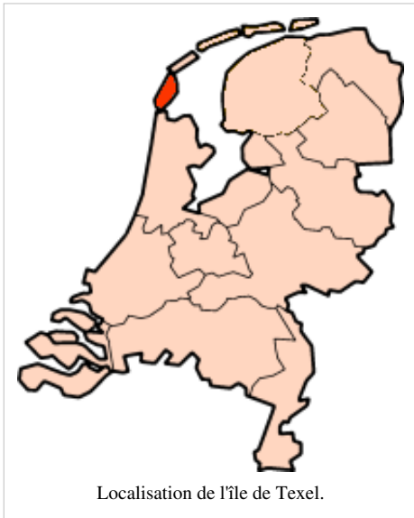
Localisation de l'île de Texel.

Le texel est originaire de l'île éponyme, située au large des Pays-Bas. C'est une race très ancienne, dont l'origine pourrait remonter à l'époque romaine. Au cours du XVIII e siècle, on cherche à améliorer les moutons de l'île en apportant du sang de moutons anglais de race leicester, lincoln et kent. Les standards de la race sont très rapidement fixés sur son île d'origine lors de concours et d'exhibitions.