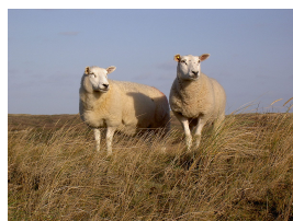
Deux brebis texel