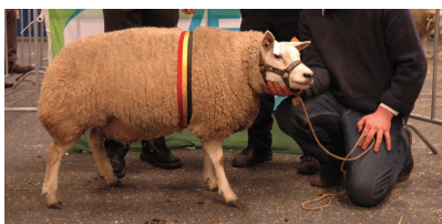
Mouton texel (type belge) lors d'un concours