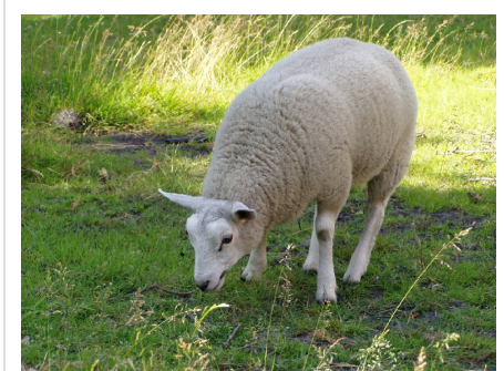
Mouton de race texel.

Le texel est un mouton à peau et à laine blanche, dense et bien frisée. Cette dernière forme une toison particulièrement épaisse, pesant en moyenne 5 kg pour les femelles et 7 kg pour les mâles, qui ne permet pas de distinguer les formes du corps. Elle ne recouvre ni les jambes, ni la tête. Celle-ci se caractérise par son chanfrein plutôt large plat, le sommet du crâne plat et le nez de couleur noir. Elle porte des oreilles de petite taille légèrement dressées. Le tronc est de forme cylindrique et la croupe horizontale. Le bassin est large et légèrement incliné. Le corps se termine par une queue assez courte implantée haut, et est portée par des membres forts se terminant par des onglons noirs. La mamelle porte des poils blancs soyeux caractéristiques.