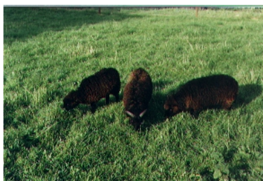
Moutons d'Ouessant au pâturage