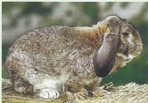
Très original avec ses oreilles retombantes, le Bélier Français peut aussi être utilisé comme lapin de compagnie.

BON À SAVOIR : le Bélier Français se distingue avant tout par ses très grandes oreilles qui retombent de chaque côté d'une tête compacte au museau renflonné. C'est une race intéressante pour ses râbles très épais et ses cuisses bien rebondies.