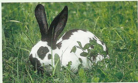
Le Géant Papillon Français est apprécié pour sa chair exquise et sa robe pie très originale. C'est aussi un lapin d'agrément.

chair à consommer par la famille, il est bien préférable de choisir des races de lapins de dimension moyenne, plus prolifiques et plus rapides à atteindre la taille consommable.