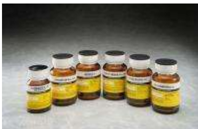
Flacons de 1 gr pour le conditionnement des conotoxines.

Analyses réalisées en externe : chromatographie en phase gazeuse.