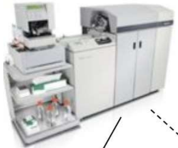
Un spectromètre de masse pour les analyses protéomiques

Analyses réalisées en interne : analyses organoleptiques, physico-chimiques.