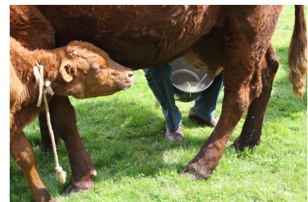
Traite d'une vache dont le veau est attaché à la patte avant

En production laitière, elle peut produire jusqu'à 2 000 - 2 400 kg d'un lait riche en matière grasse par lactation. Son lait est transformé en fromages régionaux, notamment le cantal et le salers.