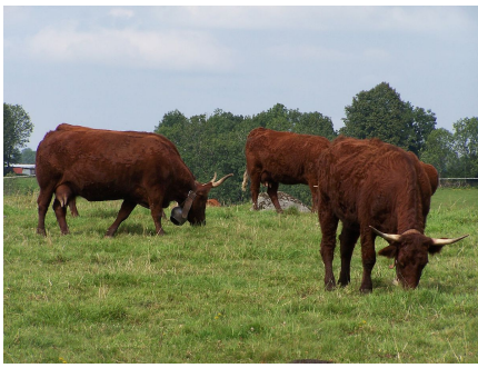
Vaches de race salers

Cette race arbore une robe acajou foncé, à poil long et frisé, et à grandes et fines cornes de couleur claire en forme de lyre. Les muqueuses sont couleur chair. Les veaux ont la même robe.