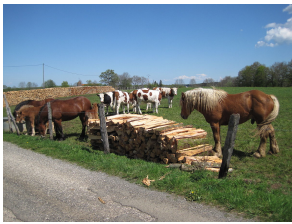
Chevaux de trait Comtois et Montbéliardes dans le Haut-Doubs