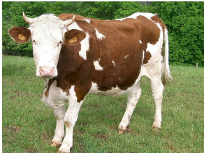
Vache montbéliarde avec ses cornes en croissant