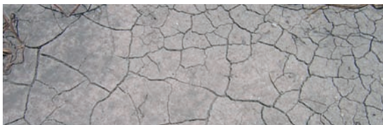
Fentes de dessiccation sur sol argileux

L'argile met du temps à se réchauffer du fait de sa structure compacte. C'est pour cette raison que les jeunes plantations mettent plus de temps à démarrer. Pour alléger sa structure, on pourra lui apporter du fumier et du compost bien décomposé qui aura pour effet de dynamiser l'activité biologique et de contribuer à son aération. On évitera également de trop le piétiner pour limiter le tassement.