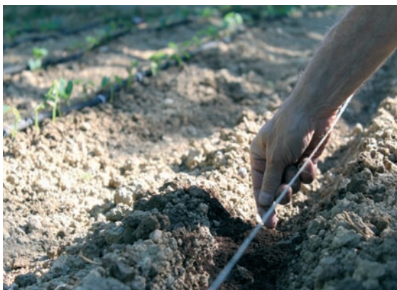
Jardin potager sur sol argilo-limoneux