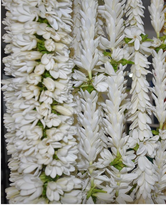
Collar de flores de tiaré Tahiti

Es costumbre local que las mujeres usen el “Tiaré Tahiti” florecido (así como la flor del hibiscus), los hombres usan “Tiaré Tahiti” sólo en botón floral. Además, si el “Tiaré Tahiti” se lleva en la oreja izquierda, significa que la persona no está en busca de compañía. Si se lleva en la derecha, significa que la persona está disponible o en empresa de busca.