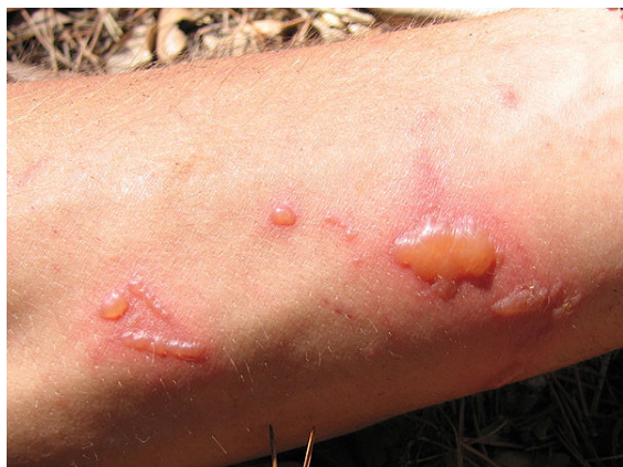
Photodermatites de contact chez les personnes à la peau sensible