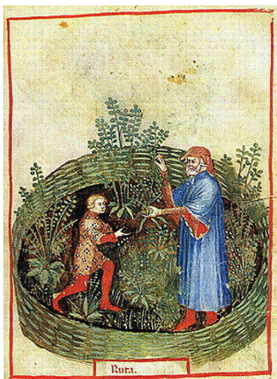
Extrait du Tacuinum de Paris ; jardin médicinal, culture de rue présentée comme élément chaud et sec au troisième degré. Optimum : Celle qui est cultivée à proximité d'un figuier. Améliore (selon cet ouvrage) la vision et favorise la dissipation des flatulences, en augmentant la quantité de sperme mais diminuant le désir de coït.

La rue était autrefois largement connue comme plante abortive, et comme telle avait mauvaise réputation [3] . Sa culture a pour cette raison été interdite par une loi de 1921 [4],[5] . Elle est toxique à forte dose ; une rumeur veut que Julia Titi, la fille de Titus serait morte après en avoir consommé lors d'un avortement forcé [6] .