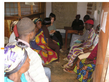
Une séance d'autoévaluation dans la zone de Bafut avec le SAILD.