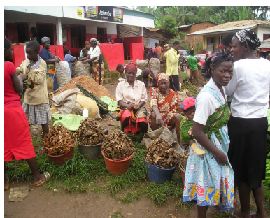
Au marché de Bafut, les femmes récoltent le fruits de leurs efforts.

Conclusion : Il est donc nécessaire que l'investissement dans l'accompagnement technique de production et de commercialisation se poursuivent et restent novateur. Un appui financier est aussi nécessaire pour contribuer aux avancées et faire face aux périodes difficiles.