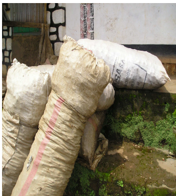
Stockage du gingembre collecté dans les zones.