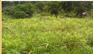
Champ de gingembre à Man-ka'ah Bafut

Dans la Province du Nord Ouest du Cameroun, le gingembre est une des principales cultures génératrices de revenus. Il se présente comme un réel espoir pour les paysans depuis quelques années. En effet, cette culture