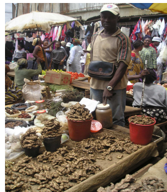
Le gingembre du Nord Ouest sur le marché de Mokolo à Yaoundé

La vente groupée est un système qui permet aux paysans de collecter leurs récoltes pour avoir une offre considérable et vendre aux meilleurs prix