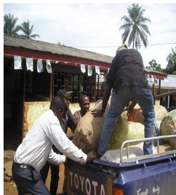
Préparation de la livraison