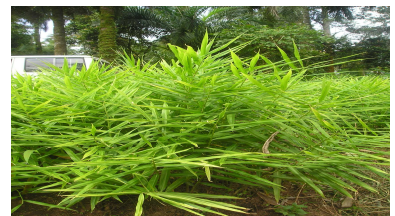
Amélioration de la production du gingembre par l'apport de fumier organique.

Une augmentation de la production dans la préservation des sols et le respect de l'environnement.