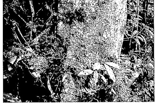
Base de l'arbre