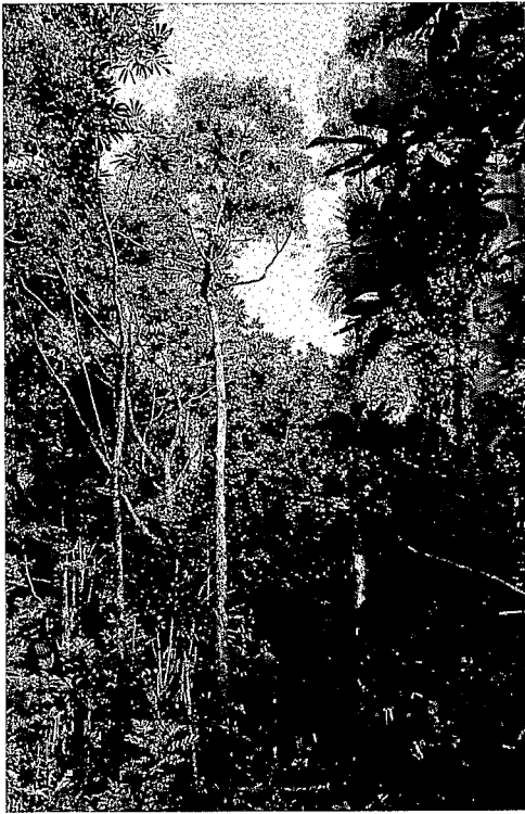
Cryptocarya elliptica Schlecht.