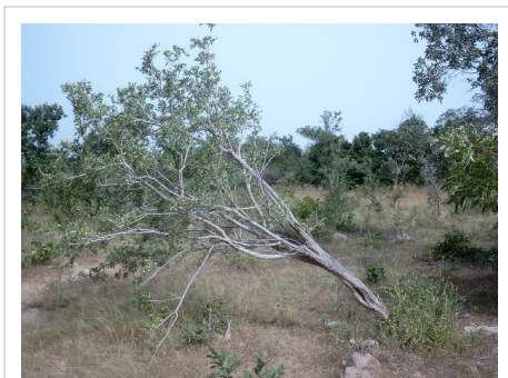
Un arbuste arraché pour en récolter ses racines

Elle fleurit d'octobre à novembre, les fleurs sont d'un violet intense et dégagent une odeur forte et sucrée. Le fruit peut rester sur l'arbre durant plusieurs mois [2] .