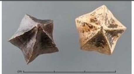
Graines de Quisqualis indica