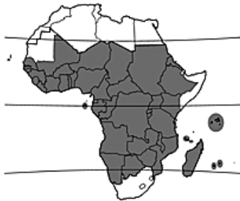
Carte de la répartition géographique En Afrique.