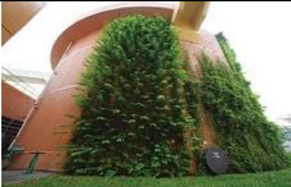
Écologisation verticale des travaux de traitement des eaux usées de Sha Tin (mur végétal).