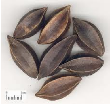
Graines de Quisqualis indica