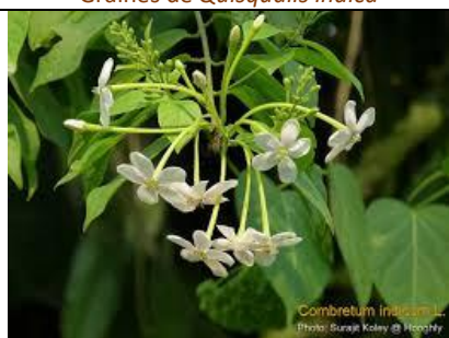
Combretum indicum L.