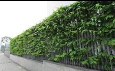
Verticulture verticale (mur végétal) sur le mur de la clôture au bureau du chef de l'exécutif