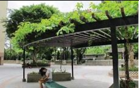
Plantation sur un abri pour l'ombrage, dans Mei Foo Sun Tsuen