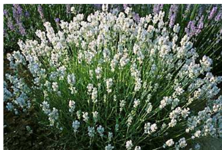
Lavandula angustifolia 'Alba' Petits épis arrondis de fleurs blanc pur en juin

Parmi les nombreuses variétés existant en voici encore quelques unes: