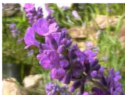
Lavandula angustifolia 'Folgate' Abondantes fleurs bleu violet lumineux en juin.