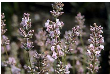
Lavandula angustifolia 'Hidcote Blue' Plante compacte, à larges feuilles gris vert. Variété célèbre pour ses magnifiques fleurs bleu violet foncé, en juin. Malheureusement la plante est très sensible à l'excès d'eau, par exemple lors des pluies d'automne.