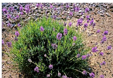
Lavandula angustifolia 'Blue Cushion' formant un tout petit coussin : c'est la plus petite de toutes les lavandes ! Feuilles gris vert. Epis très courts de fleurs bleu mauve en juin.